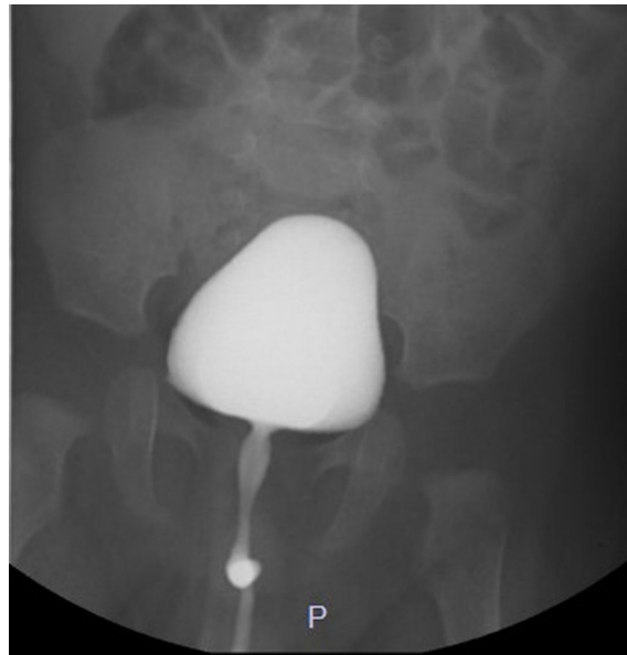
Resim 3. Sistografik incelemede işeme fazında normal mesane görünümü