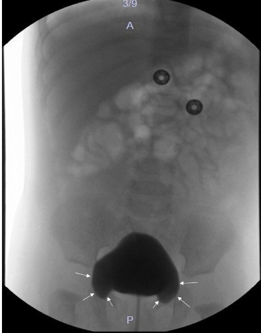
Resim 1. Sistografik incelemede doldurulmuş fazında kulaklı mesane görünümü. Mesane kulakları beyaz oklarla gösterilmektedir.

kulaklı mesane olarak değerlendirildi (Resim 2 ve 3). Mevcut üreter dilatasyonu ayırıcı tanısı için yapılan dinamik böbrek sintigrafisinde ise obstrüksiyon tespit edilmedi. Hasta takibe alındı.