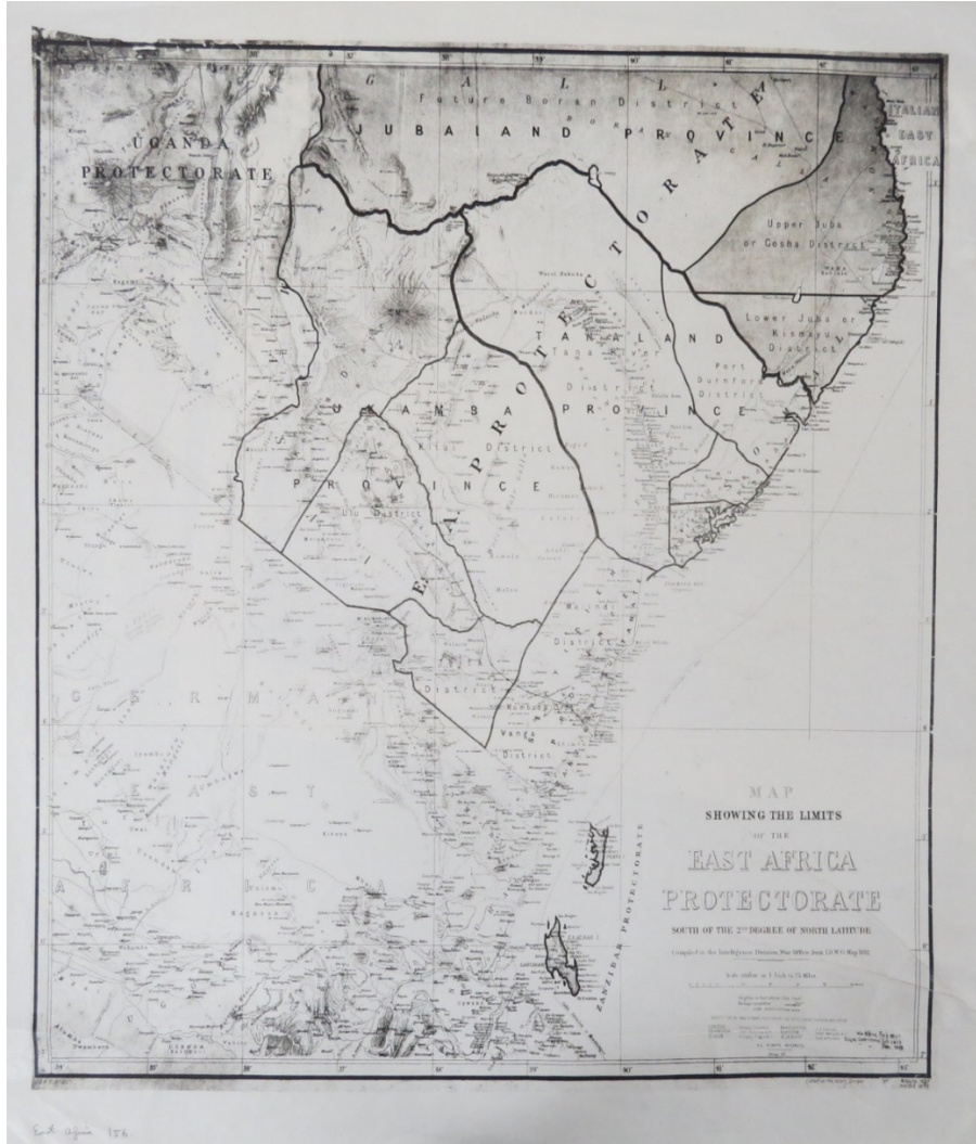
Ek 1: Uganda Protectorate ve Doğu Afrika'nın Paylaşımı (CO 1047/176)