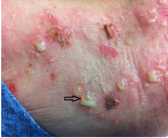
Resim 1. Püyün alt yarıda toplandığı 'hipopiyon belirtisi'.

Dermatolojik muayenede her iki ayak dorsalinde viyolemsi ve ödemli zeminde vezikülopüstüller, ekstremitelerde ve gövdede dağınık yerleşimli eritemli, ödemli zeminli büller, vezikülopüstüller ve erozyonlar ile oral mukozada yüzeysel fibrinöz materyalle kaplı yaygın erode alanlar saptandı. Vezikülopüstüller deri lezyonlarının bazılarında hipopiyon belirtisi fark edildi (Resim 1).