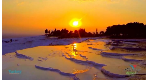
Fotoğraf 3- Denizli Tanıtım filminde Pamukkale travertenleri (Denizli Valiliği).

(Denizli Valiliği, Büyükşehir Belediyesi, Denizli İl Kültür ve Turizm Müdürlüğü ve Pamukkale Belediyesi) logolarında Pamukkale Travertenleri figürünü kullanılması (Şekil 3), kent için simgesel anlamını ifade eder. Ayrıca Pamukkale, Denizli için idari ve kültürel anlamda büyük önem taşır. Zira Pamukkale ismi Denizli'de birçok kamu kuruluşu, yer ismi ve şirkete verilmiştir. Bunlardan en dikkat çekici olanı Büyükşehir yasasından sonra Denizli il merkezinin ikiye bölünmesi ve merkez ilçelerinin birine Pamukkale ismi verilmesidir. Ayrıca 1992 yılında kurulan üniversiteye "Pamukkale Üniversitesi" ismi verilmesi, kent için kültürel önemini ortaya koymaktadır. Daha önce bahsi geçen "Bunları Biliyor Musunuz?" isimli Denizli tanıtım kitapçığında Denizli Horozundan sonra Pamukkale travertenlerinin özelliklerine yer verilmiştir. Kitapçıkta Pamukkale travertenleri dünyanın sekizinci harikası olarak tanımlanmaktadır. Ayrıca, Denizli Valiliği tarafından hazırlanan tanıtım filmin girişinde Pamukkale travertenlerinin gösterilmesi (Fotoğraf 3) ve Pamukkale'nin Denizli'nin simgesi haline geldiğini belirtmesi, kent kimliği açısından önemini vurgular.