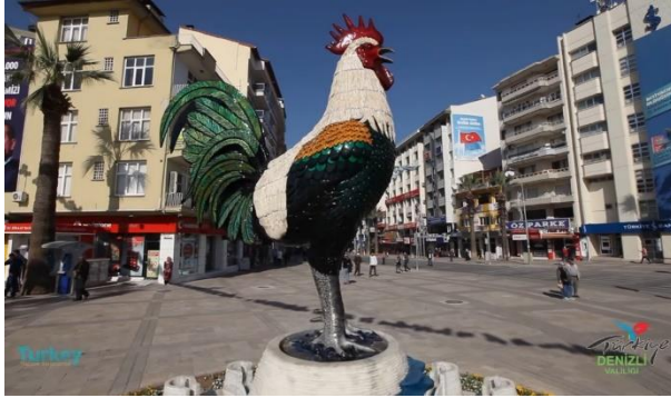
Fotoğraf 2- Denizli’nin tanıtım filminde yer alan horoz heykeli (Çınar Meydanı)

kentin fiziki ve beşerî coğrafya özelliklerini yansıtarak, kentin fonksiyonel özelliği ile ilgili ipuçları verir (Uzun ve Özcan, 2014). Bu durum Denizli’de bulunan kamu kurum logoları için de geçerlidir. Zira Denizli Valiliği, Büyükşehir Belediyesi, Denizli İl Kültür ve Turizm Müdürlüğü ve Pamukkale Belediyesi gibi resmî kurumların logolarında Denizli Horozu, Pamukkale Travertenleri ve tarihsel yapılara yer verilmiştir. Söz konusu unsurlar, kentin simgesi haline gelmiş ve kentle özdeşleşmiş simgelerdir. Şekil 3’de görüldüğü üzere Denizli’de bulunan resmî kurumlara ait logolarda, horozun ana tema olarak işlenmesi, kent kimliği açısından önemini gösterir.