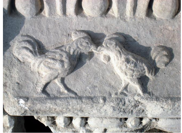
Fotoğraf 1- Laodikya Antik Kenti’nde bulunan Denizli Horozu kabartması (Şimşek, 2011).

olarak tanıtılmak ve Denizli horozunun Çınar Meydanı’ndaki heykelinin özelliklerinden söz edilmektedir. Bu durum, büyükşehir belediyesinin Denizli kentini tanıtırken Denizli horozundan başlaması, kent tanıtımı için horozun ne kadar önemli olduğunu açıklar. Ayrıca Denizli Horozu, Denizli Valiliği tarafından hazırlanan tanıtım filminde kentin simgelerinden biri olarak gösterilir (Fotoğraf 2). Tanıtım filminde Denizli horozun uzun ötüşünden ve diğer özelliklerinden bahsedilerek kent için önemine vurgu yapılır. Ayrıca TÜİK tarafından hazırlanan Seçilmiş Göstergelerle Denizli 2013 isimli çalışmanın başında kentin tanıtımına dair bilgilerin yer aldığı bölümde “Denizli Horozu, Denizli’nin sembolüdür.” ifadesine yer verilmiştir. Bu ifade Denizli horozunun kentin sembolü haline geldiğini ve resmi yayınlarda da yer aldığını gösterir.