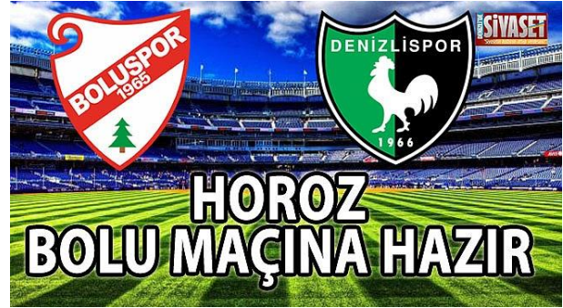
Şekil 4- Denizli’nin yerel internet sitesinde (Denizli’de Siyaset) yer alan Denizlispor’u ile ilgili bir haber.

Denizlispor’un ismi hem de simgesi olmuştur. Çeşitli gazete manşetlerinde ve internet haber kanallarında Denizlispor’u yerine “Horoz” ya da “horozspor” ifadeleri kullanılmaktadır. Ayrıca Denizlispor kulübünün resmi logosunda da horoz imgesi yer alır. Şekil 4’teki görselde görüldüğü üzere bir internet haber kanalında Denizlispor yerine Horoz ifadesi kullanılmıştır. Bu durum, horozun Denizlispor’la özdeşleşmiş, hatta aynı anlamda kullanıldığını gösterir. Çamdereli ve Gürer’in ifade ettiği gibi (2008) “horoz dolgusu, kentin bilinirlik ve tanınırılık ögesi olarak temsil göstergesine yalın biçimde görselleştirir. Kentsel aidiyet ve kentsel anılma bağlaşımda öne çıkan ‘horoz’ imgesi canlılığın, diriliğin, gururun ve uzun solukluluğun imgesi olarak katılır yüzey kurgusuna”.