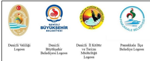
Şekil 3- Denizli’de çeşitli resmî kurumların logosunda kullanılan horoz ve Pamukkale travertenleri figürü.

Photo 2- Rooster sculpture in Denizli's promotion video (Çınar Square)