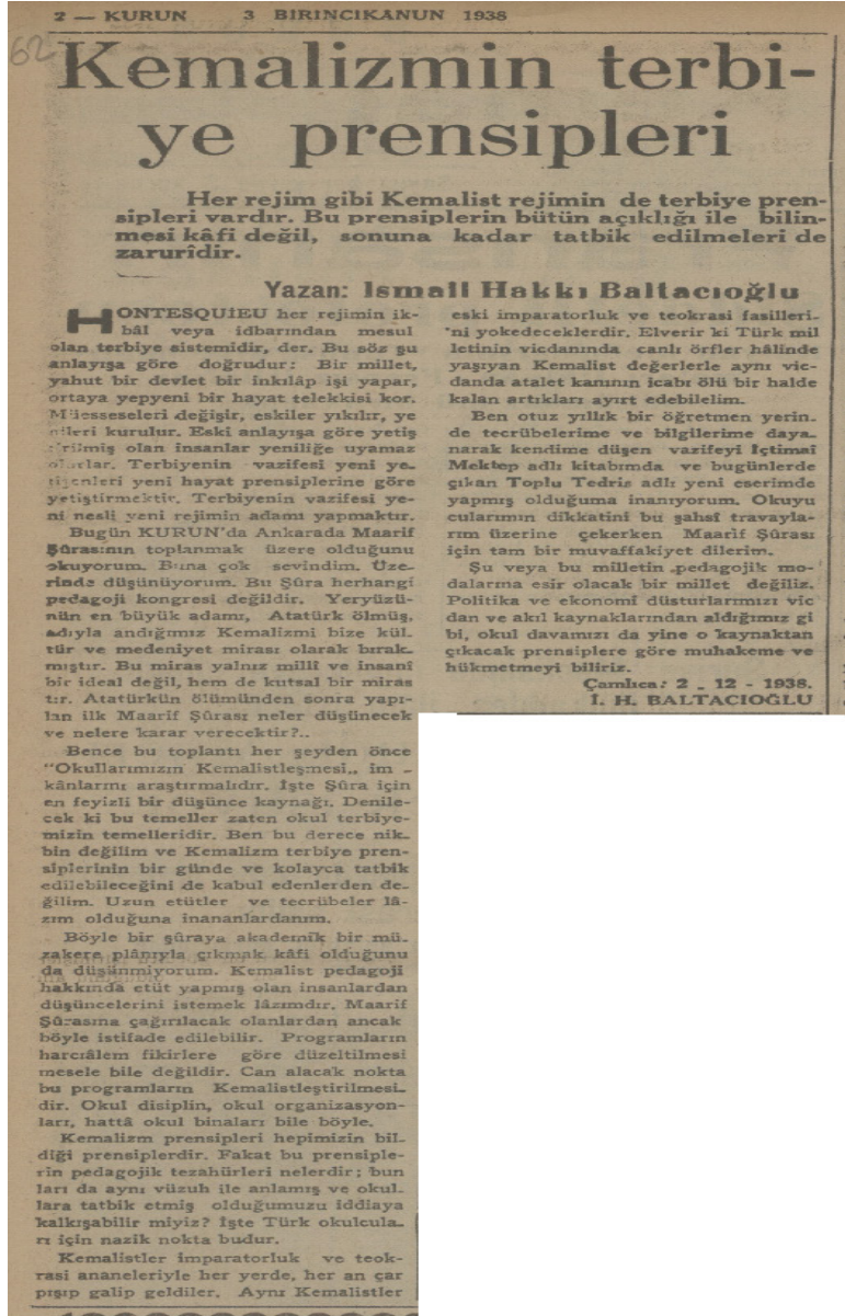
EK 5: Kurun, 3 ARALIK 1938.