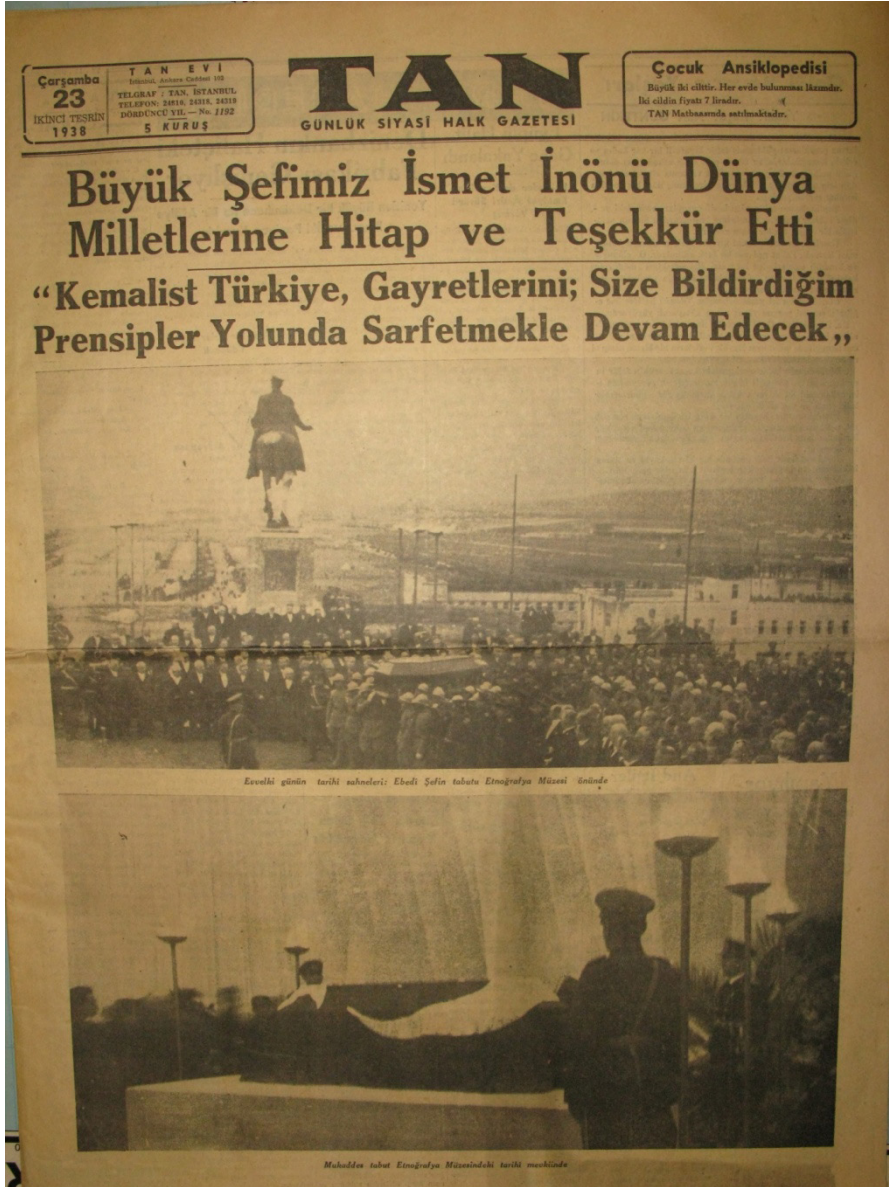
EK 6: Tan, 23 Kasım 1938.