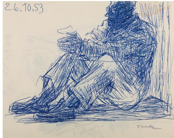
Şekil 3. Fikret Mualla'nın 26.10.1953 Tarihli Desen Çalışması.

Neşet Günel'in de ifade ettiği gibi sağlam bir desen bilgisine sahip olan Fikret Mualla, sürekli çizdiği desenlerinde kendi özgün; modern dilini oluşturmuştur. Desenlerinin genel konusunu günlük yaşamdan anlıklar oluşturur. Bu anlıklar kent yaşamından kaçış çabasını içerdiği gibi; yaşamın anlamına yönelik desen yoluyla araştırmaları da içerir.