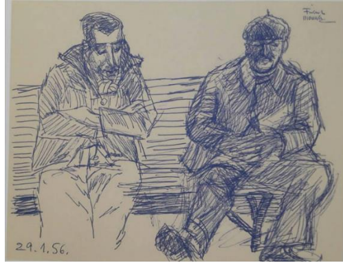
Şekil 4. Fikret Mualla'nın 29.01.1956 Tarihli Desen Çalışması.

Cezanne'dan beri süregelen modern ressamların özcü tutumlarını Mualla'nın özellikle desenlerinde görmek olanaklıdır. Onun desenleri Van Gogh'un desenlerinde de olduğu gibi görülmeyeni gösterme çabasını içerir: Doğanın içinde gizil kalan gerçekliği; kendi dilinde aktarır.