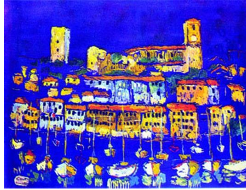
Şekil 1. “Cannes Limanı”, suluboya, Angels Koleksiyonu.

Fikret Mualla'nın “Cannes Limanı” adlı resminde ilk bakışta gözümüze mavi bir zemin üzerine yapılan bir peyzaj gözükmektedir. Peyzajın içinde çeşitli yapılar, tekneler, deniz ve gökyüzü görülmektedir. Peyzajda yapılar sıralı halde görülmekte ve bu yapıların alt tarafında tekne imgeleri görülmektedir.