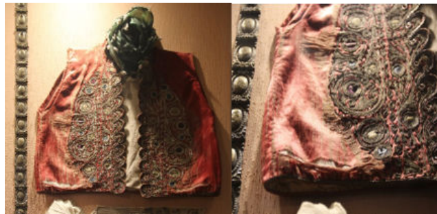
Görsel 1. İşlemeli yelek ve detay

İşlemeli ipeklilik dikilmiş yelek gümüş takılar odası vitrin 10'da sergilenmektedir. Eser vitrinde sergilenmekte olduğu için ölçü bilgilerine envanter belgesinden ulaşılmıştır. Yeleğin ön beden uzunluğu 47 cm, en beden genişliği 45 cm dir. Eser 24.02.1976 tarihinde Seyfettin Kiraz'dan alınarak müzeye gelmiştir. Ön beden stilize edilmiş çiçek dalı motifinde sim ile işlenmiştir. Kimi çiçek motifinin ortasında yeşil veya lacivert renkli iplikler kullanılmıştır. Yeleğin ön kapaması/ön ortası açık ve kenarları dalgalı/dilimli bir görünüme sahiptir. İçi beyaz astarlı, kol oyuntusu makine ile çekilmiş yelek müzeye geldiğinde kumaşı yıpranmış bir halde olduğu envanter belgesinde belirtilmiştir (Bkz. Görsel 1). Yelek, yaka tarafından başka bir eserle beraber kumaş kaplı vitrin içerisinde dikey bir şekilde iğnelenerek tutturulmuştur ve bu şekilde sergilenmektedir. Öncelikle yeleğin kumaşındaki yıpranmalar göz önüne alındığında sergilenmesi sırasında eserin direk bir yüzeye iğnelenerek değil de içten bir destek ile dayanıklılığını azaltmayacak şekilde sergilenmesi yönünde bir değişikliğe gidilebilir. Eserin içten bir askı ile desteklenerek asılması veya eserin algılanmasında eserin önüne geçmeyecek şekilde uygun materyalden bir vitrin mankeni üzerinde yeleğin arkasının da ziyaretçiler tarafından algılanabilecek şekilde sergilenmesi önerilir.