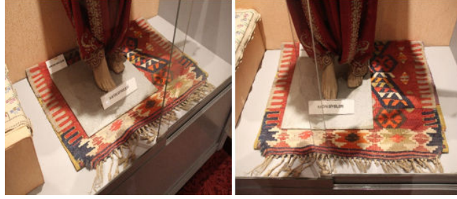
Görsel 6. Kurtluca kilimi ve detay

Sergide ziyaretçilerin algılaması ve eser hakkında bilgi edinmeleri için farklı çözümler düşünülmelidir. Eserin muadilleri ile birlikte motiflerinin, renklerinin rahat algılanabileceği bir sergileme alanı ayrılabilir. Dokuma tarihi ve örnekleri ile ilgili görsel poster ve bilgilendirici tabelalar eklenebilir.