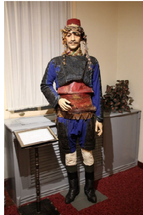
Görsel 7. Selcenli Hüseyin Efe kıyafetleri

1889 yılı Denizli Çal ilçesi Selcen köyü doğumlu Selcenli Hüseyin Efe'ye ait cepken, efe tumanı, kuşak, fişeklik ve sarık manken üzerinde silahlar seleksiyonu odasında sergilenmektedir. Selcenli Hüseyin Efe, Balkan ve Çanakkale savaşlarına katılmış, yaralandığı için köyüne geri dönmüş ve İzmir'in işgali sonrasında Çal'da kurulan Kuvayi Milliye Teşkilatına katılmıştır. Daha sonra Aydın'ın işgali üzerine Aydın Kuvayi Milliye Teşkilatına katılarak Demirci Efe ile birlikte çalışmıştır. Cumhuriyetin kuruluşundan sonra Milis Üsteğmen unvanı alan Selcenli Hüseyin Efe'ye vatana hizmetlerinden ötürü 200 TL para yardımı yapılmıştır. 1966 yılında da vefat etmiştir. Eserler Mehmet Yıldırım tarafından hibe edilerek 30.12.1999 tarihinde müzeye gelmiştir. Arkadan bir misina yardımı ile radyatöre sabitlen manken açık bir alanda sergilenmektedir (Bkz. Görsel 7). Envanter bilgilerine ulaşılabilen efe cepkeni, tumanı, kuşak, fişeklik ve sarık incelenmek üzere seçilmiştir. Eserler ayrı başlıklarda envanter bilgilerinden elde edilen bilgiler ile tanımlanıp koruma, sergilenme koşulları ve öneriler şeklinde verilmiştir.