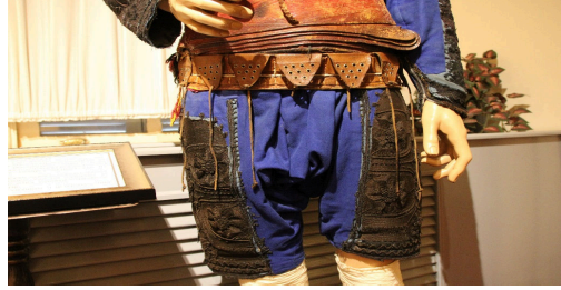
Görsel 9. Efe tumanı

Tuman, genel anlamıyla don veya bol ve kısa iç donu anlamlarına gelmektedir (Gülensoy, 2007, s. 133). Yörelere göre farklı biçimlerde olabilmektedir müzede bulunan eserin bacak arası ağı, beli ise uçkurla büzgülüdür. Manken üzerinde sergilenen efe tumanı 50 cm uzunluğundadır. Cepkende olduğu gibi açık mavi kumaş üzerine siyah ip işlemleri bulunmaktadır ve lastik evi olan bel kısmı için kırmızı bir kumaş kullanılmıştır. Koyu mavi renkli kumaş ile onarım görmüştür. Paça uçları ve lastik evi yıpranmıştır (Bkz. Görsel 9).