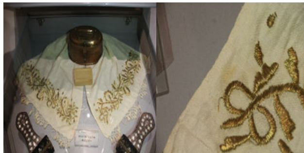
Görsel 3. Hamam peşkiri ve detay

Peşkir hamam seti teması ile yatay olarak konumlandırılmış bir vitrin içerisinde sergilenmektedir. Hamam takımı temasının içerdiği diğer objelerin tekstil eser ile temas halinde sergileniyor olması eserin diğer materyallerden kaynaklı bozulmalara açık olduğu noktasında endişe vericidir. Eserin birlikte kullanıldığı diğer objeler ile birlikte sergileniyor olması teması aynı şekilde kalarak obje dizilimleri tekrar gözden geçirilmelidir. Eserin sergilendiği vitrinin üzerindeki diğer vitrinin sebep olduğu eserlerin algılanmasındaki güçlüğü giderilmesi için de vitrin düzeni tekrar kurgulanabilir.