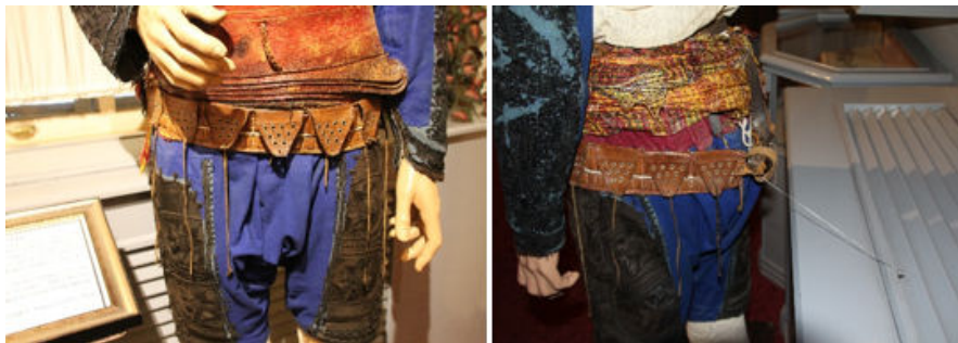
Görsel 11. Fişeklik ve radyatöre sabitlenme detayı

Fişeklik, üzerine tüfek, tabanca fişeklerinin geçirildiği bele veya omuza asılabilen kemerdir ("Fişeklik", t.y.). Fişeklik 7 cm eninde ve 123 cm boyundadır. Kahverengi deriden on iki kapaklı ve zımbalı bölüme ayrılmış fişeklik bir kemer tokası ile arkadan kordona bağlanmaktadır. Bölümler kapak şeklinde ve altta ince deri ipler ile bağlanmaktadır. Fişeklik ve dolayısı ile efe manken sabit durması için misina ile radyatöre sabitlenmiştir (Bkz. Görsel 11).