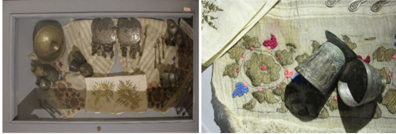
Görsel 5. Peşkir (bürümcük) ve detay

Eserin sergilendiği yatay vitrinin eser üzerine gölgesinin düşmesi nedeniyle algılanmasını zorlaştırmaktadır (Bkz. Görsel 5). Eser hakkında bilgilendirici bir unsur da eklenmesi diğer tüm eserlerde olduğu gibi ziyaretçiler için daha verimli bir müze gezisine katkı sağlayacaktır.