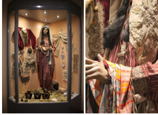
Görsel 4. Cepken-şalvar ve detay

motifli ve yakada kullanılan sutaşı ile çevrelidir. İçi beyaz astarlıdır. Şalvarın kenarlarında sim ve sırmadan işlenmiş motifler vardır ve iyi halde korunmuşlardır. Paçaları dar olan bu şalvarın astarı bulunmaktadır. Envanter belgesinde, eserlerin biçimsel özellikleri ve türlerine dair bir bilgi yer almamaktadır. Eserin manken üzerinde diğer metal eserler ile birlikte sergileniyor olmasının tekstil eserlerin korunma sürecinin kontrolünü zorlaştırmasının yanında eserlerin algılanmasını da zorlaştırmaktadır. Vitrin içerisinde ve manken üzerindeki eserlerin konumu ile sayısı eserlerin detaylarının ve bütünü algılanmasını zorlaştırmıştır (Bkz. Görsel 4).