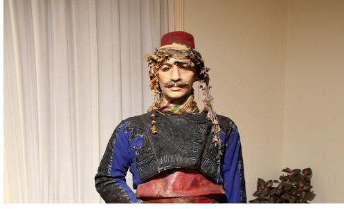
Görsel 12. Sarık

Eserin biçimsel özelliklerinin, kullanılan kumaş ve hammadde türlerinin belirlenip envanter belgesine eklenmesi çeşitli açılardan yapılacak olan çalışmalara kaynaklık etmesi açısından önemlidir. Silah seleksiyon bölümünde odasında bir manken üzerinde sergilenen eserlerin çevresel koşullardan korunmasını zorlaştıran en önemli etken mankenin açık bir alanda bulunmasıdır. Eser müzedeki çevresel koşulların değişiminden etkilenen organik malzemelerden yapılmış olduğu için kapalı bir yerde sergilenmesi daha uygun olacaktır. Hava kirliliği, bağıl nem değişiminin yanı sıra ziyaretçilerden gelebilecek her türlü bozulma tehlikesine açık haldedir.