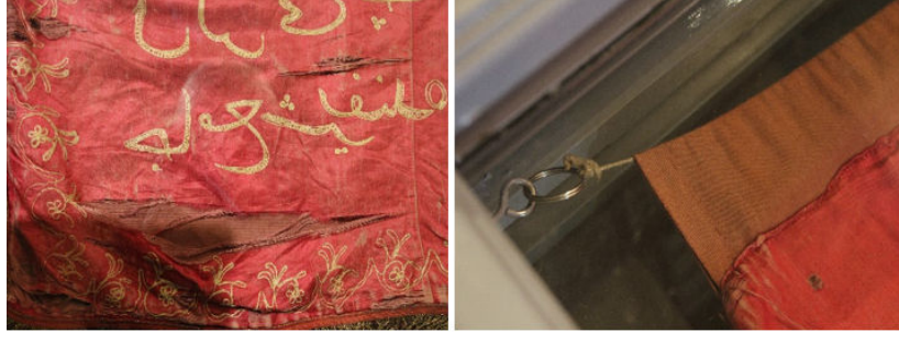
Görsel 14. Yırtık ve asılma detayı