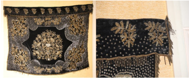
Görsel 2. Ocak örtüsü ve detay

Eserin açık bir alanda sergilenmesinin özel bir amacının gözlemlenememesi sebebi ile sergi odasının kapısına ve müzenin ana kapısına yakın konumunun değiştirilerek, değişken çevresel faktörlere karşı korunmasını kolaylaştırmak adına kapalı bir yerde sergilenmesi düşünülebilir. Vitrin arka planında dikkati eserden uzaklaştırmayacak bir şekilde bir ocak çizimi eklenmesi gibi eserin kullanımı hakkında bilgi veren yazı ile ek çözümler üretilebilir.