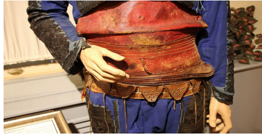
Görsel 10. Kuşak

Kuşak 22 cm eninde ve 40 cm boyundadır. Kapak kısmı 11 cm eninde ve kayışın boyu 130 cm uzunluğundadır. Kalın kat kat kırmızı deriden yapılmış içe dönük kapaklı kuşağın 2 kemer tokası ve 1 uzun kayışı vardır. Müzeye geldiğinde çok yıpranmış bir halde olan kuşağın iç kısmında delikler ve cep şeklinde bir yaması bulunmaktadır (Bkz. Görsel 10).