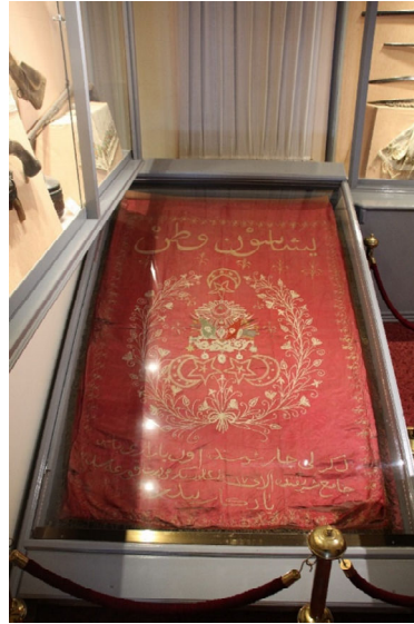
Görsel 13. Denizli Sancağı

Müzenin koleksiyonun önemli bir parçası olan sancağın sergideki ziyaretçilerin ilgisini daha fazla çekebilecek bir şekilde tekrardan müze içinde konumlandırılması düşünülebilir. Mevcut yerinde etrafındaki vitrinlerin aydınlatmaları ve gölgeleri sebebi ile eser rahat bir şekilde incelenememektedir.