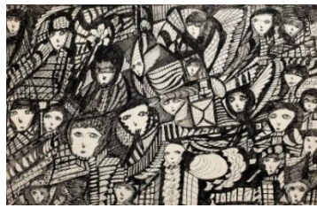
Resim 11. Madge Gill İsimli

Bir diğer sanatçı, İngiliz Madge Gill (1884-1961), kendisine resim çizme emri veren “görülmemiş bir gücün” rehberliğinde hatları iç içe geçip bozulmuş genç kız portreleri çizmiştir. Portrelerini çizerken ona seslenen bir kadın sesiyle hareket ettiğini söylemektedir. Belki de bu ses onun korkularının ya da bastırılmış duygularının sesleridir. Çözülmemeyen iç içe geçmiş portreler karmaşayı ve çözülmemeyen ilişkileri yansıtmaktadır.