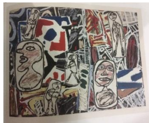
Resim 2: Jean Dubuffet “Unutulmaz olaylar 1” 1978 Üç Renkli İpek Baskı