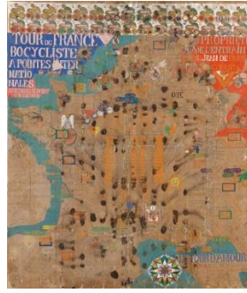
Resim15: Sylvain Lecocq

( http://www.artbrut.ch/en/21004/1137/lecocq--sylvain- )