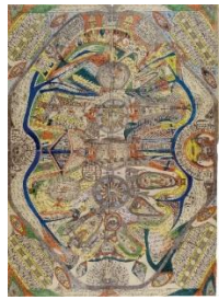
Resim 10: Adolf Wölfli Neveranger adasının genel görünümü, 1911 ( https://web.archive.org/web/20160825172255 )

Wölfli'nin eserleri, 1972 yılında Bern'de kurulan Adolf Wölfli Vakfı tarafından koruma altına alınarak ve Bern Güzel Sanatlar Müzesi'nde sergilenmeye başlamıştır.