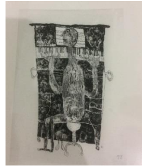
Resim 7 : Jean Dubuffet “Piyaniist” 1944 Taşbaskı

Kâğıt üzerinde çalıştığı büyük boyutta resimleri, yeni görseller ve ilkel imgeler olarak karşımıza çıkar. Biçimsel açıdan değişen çalışmaları onun önünü açar ve "Hourloupe" serisine başlar. Jean Dubuffet, heykel çalışmalarında projeden anıta kadar farklı teknik ve üsluplar kullanır.