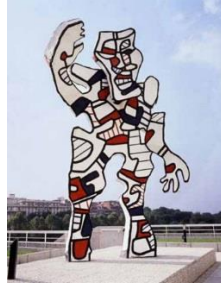
Resim 8: Jean Dubuffet, “Karşılama”, 1988.

Poliüretan üzerine epoksi boyamayla, 6 m yüksekliğinde, maketi 1973'te hazırlanıp 1988'de bitirilmiş bir çalışmadır. Paris Halk Hastanesinin inşası sırasında, mimar Pierre Riboulet tarafından sipariş edilmesi üzerine gerçekleştirilmiştir. Dubuffet Washington Ulusal Galeri girişi için çeşitli projeler geliştirmiştir. Beyaz üzerine siyah, kırmızı ve mavi çizgilerle bir eli yukarda ayakta duran figürün hatları ve konturları belirlenmiştir. Heykelin hastane önündeki yeri ve konumu hasta çocukları selamlar şeklinde düşünülmüştür.