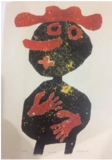
Resim 6: Jean Dubuffet “Havuç Burun” 1961 Taşbaskı