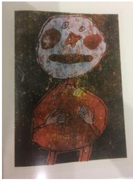
Resim 4: Jean Dubuffet, “Kırmızı Giysili Kişi” 1961 Taşbaskı