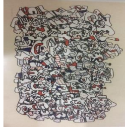
Resim 3: Jean Dubuffet “Kalabalık Kent” Renkli İpek Baskı