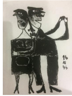
Resim 5: Jean Dubuffet “Vals” 1944 Taşbaskı