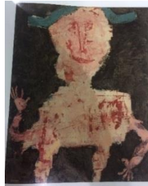
Resim 1: Jean Dubuffet “Yeşil ŞapkalıAdam” 1954 tüyb

Aşağıda sanatçının farklı dönemlerinde farklı tekniklerle oluşturduğu eserlerinden örnekler sunulmuştur. Eserlerinde zaman ya da mekân mefhumu olmadan içten ve doğal kompozisyonlarını taş ve ipek baskı tekniğiyle birlikte, karışık tekniklerle üretmiştir. Grafiti tarzı kompozisyonlarında estetik bir kaygı gütmeyen çalışmalarını poliüretan malzemelerle şekillendirmiştir.