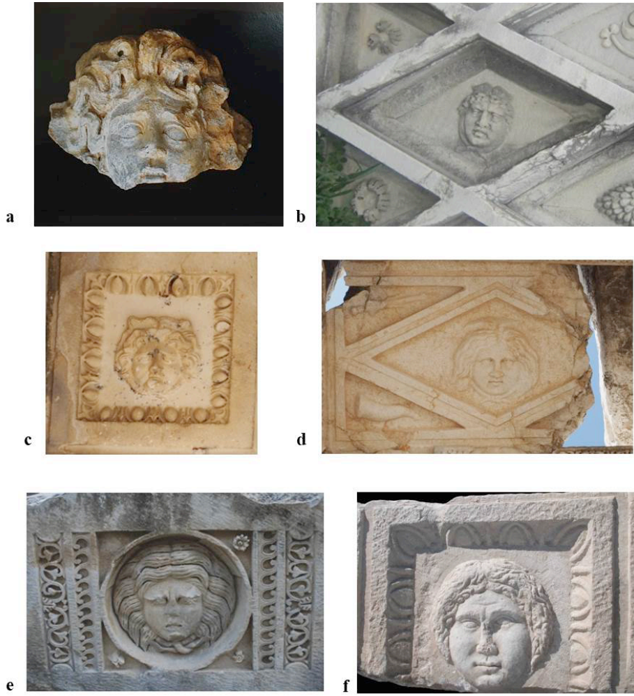
Figür 7: Tavan ve kemer kaseti bloklarında betimlenen Medusa bezemeleri. a. Aizanoi Tiyatrosu b. Side Tiyatrosu c. Aspendos Tiyatrosu d. Sagalassos Antoninler Nymphaeumu e. Myra Tiyatrosu f. Laodikeia Anıtsal Propylonu.