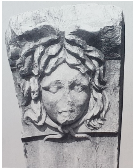
Figür 9: Miletos Tiyatrosu'nda, kemer kilit taşı bloğunda betimlenen Medusa başı.