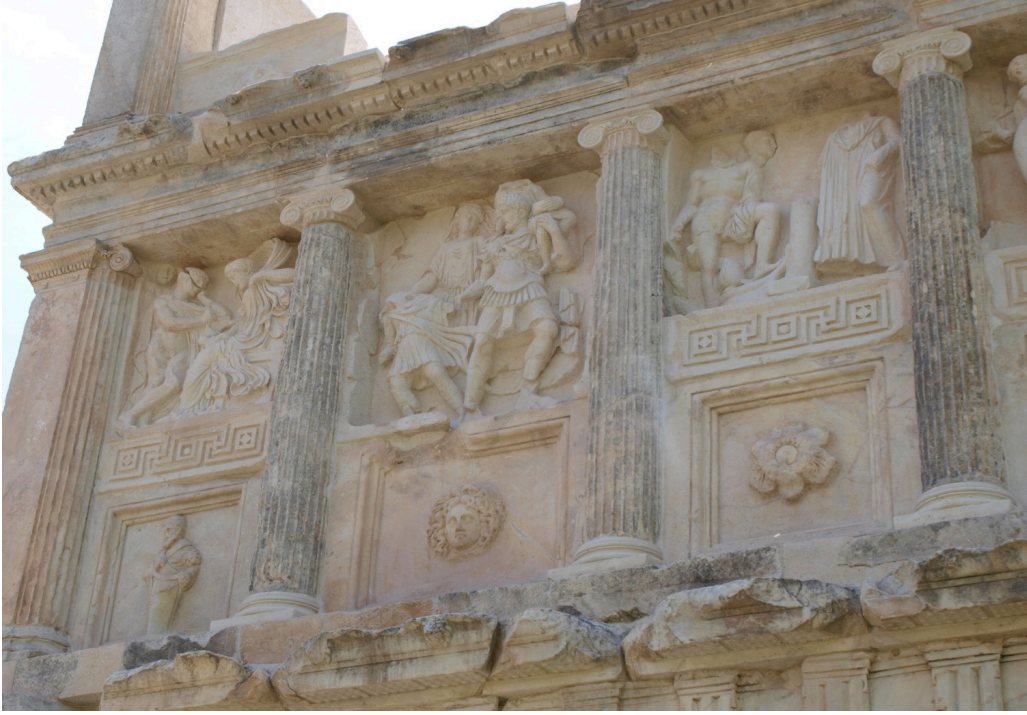
Figür 3: Aphrodisias Sebasteionu, güney portiğinde kabartmalı panellerin kaidesinde kullanılan Medusa bezemesi.