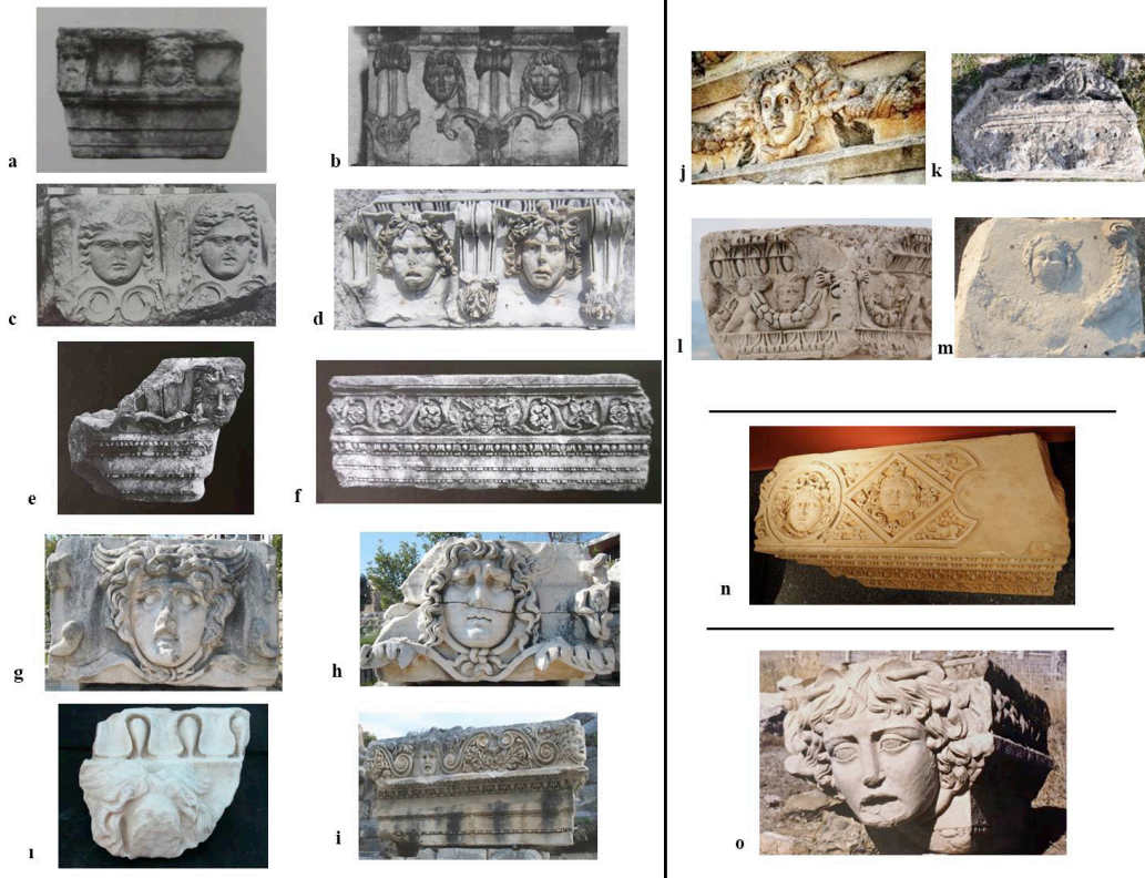
Figür 6: Arşitrav-Friz bloklarında betimlenen Medusa bezemesi. a. Aphrodisias Sebasteionu Propylonu b. Pergamon Traian-Hadrian Tapınağı c. Claudipolis Tapınağı d. Side N1 Tapınağı e. Prusias ad Hypium f. Prusias ad Hypium g. Didyma Apollon Tapınağı h. Didyma Apollon Tapınağı i. Laodikeia j. Myra Tiyatrosu k. Aphrodisias Tiberius Portiği l. Kibyra Nymphaeumu m. Hierapolis Tiyatrosu n. Tlos Tiyatrosu o. Perge Güney Hamam Propylonu p. Hierapolis Agorası.