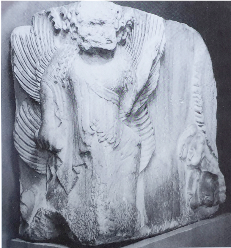
Figür 2: Didyma Apollon Tapınağı'nın Arkaik Dönem frizlerinde betimlenen Medusa.