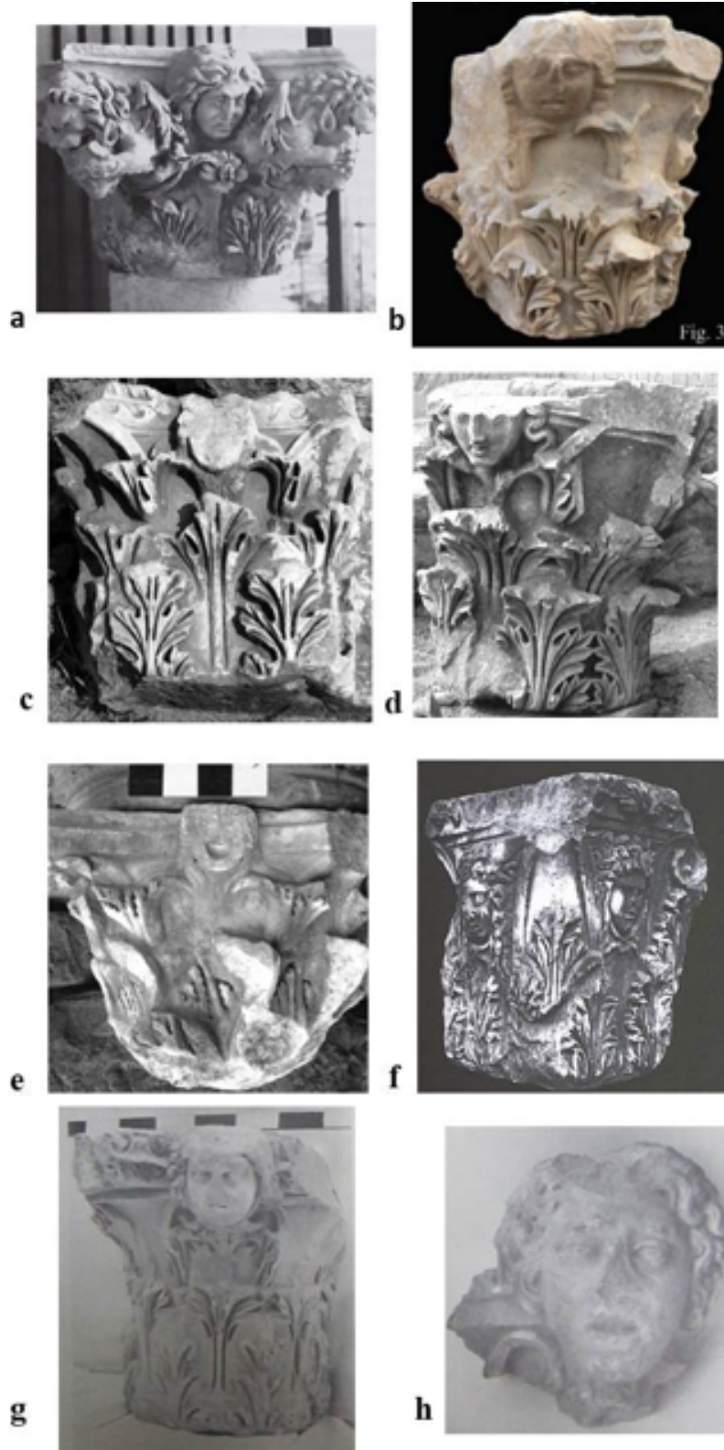
Figür 5: Figürlü başlıklarda kullanılan Medusa bezemesi. a. Hierapolis Bazilikası b. Parion Tiyatrosu c. Perge Güney Hamam Propylonu d. Perge Güney Hamamı Propylonu e. Perge Severuslar Nymphaeumu f. Prusias ad Hypium g. Sardes Gymnasiumu h. Sardes.