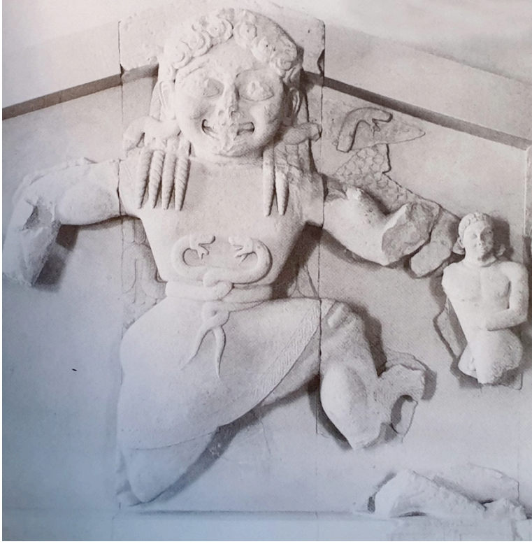
Figür 1: Korfu, Artemis Tapınağı'nın batı alınlığında betimlenen Medusa.