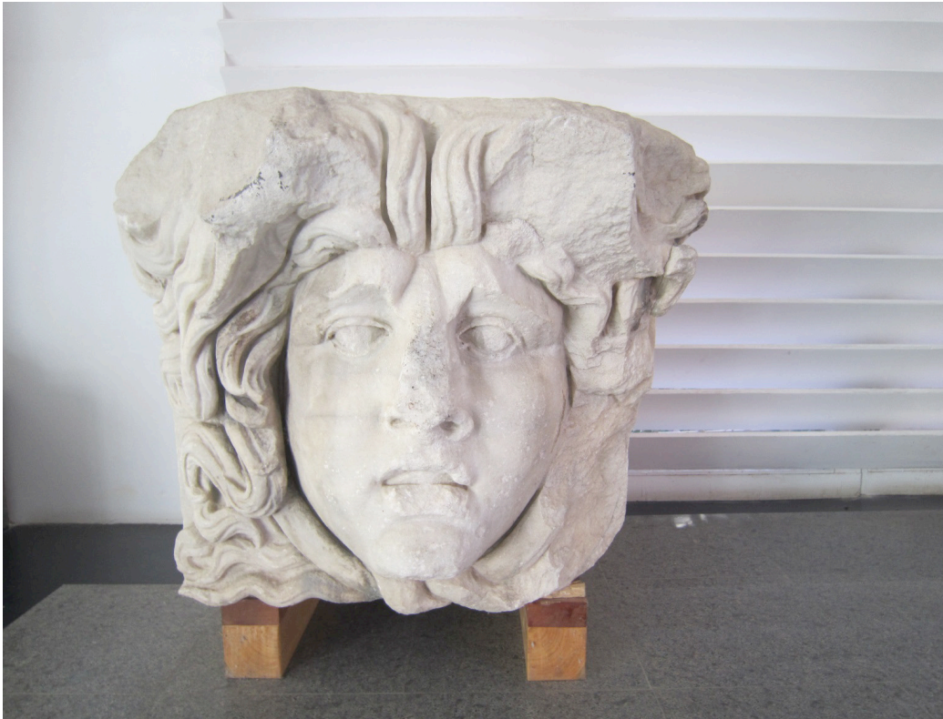
Figür 4: Aphrodisias Hadrianus Hamamı'nda konsol bloğuna işlenen Medusa.