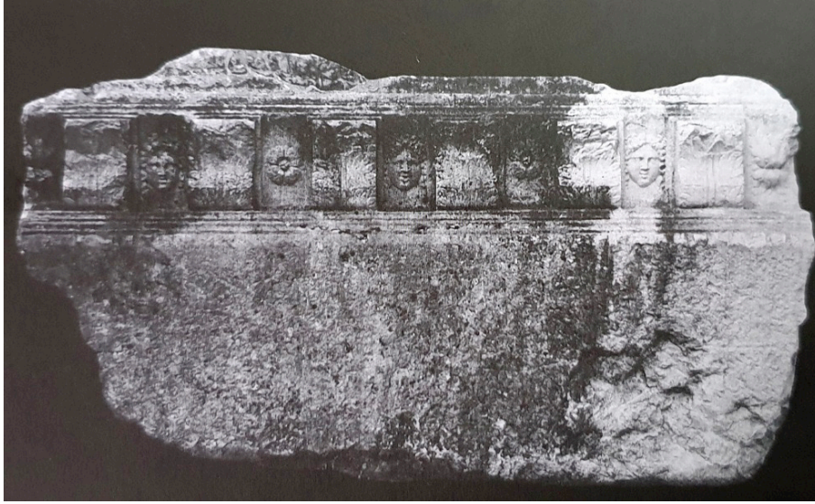
Figür 8: Prusias ad Hypium'da konsollu geison bloğunun konsol kasetlerine betimlenen Medusa.