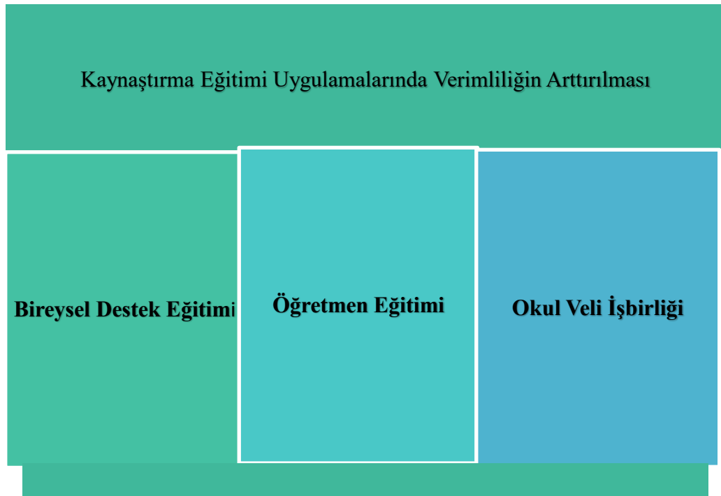
Şekil 4.1.3 Kaynaştırma Eğitimi Uygulamalarında Verimliliğin Arttırılması

Araştırmaya katılan dokuz okul yöneticisi ve 14 öğretmene, kaynaştırma eğitimi, uygulamalarında verimliliğin arttırılması ile ilgili soru yöneltilmiş, verilen cevaplarda, özel gereksinimli öğrencilerin özel eğitim okulu ve okulda kurulan, uygun ders araç gereci ile donatılmış destek eğitimi odasında, sınıf ortamından ayrı bireysel destek eğitimi almaları, eğitim verebilecek donanımlı öğretmenlerin olması veya tüm öğretmenlerin özel gereksinimli öğrencilerin eğitimi ilgili bilgi eksikliğinin giderilmesi için öğretmen eğitimi, veli okul işbirliğinin arttırılması sonuçlarına ulaşılmış, Şekil 4.1.3 te gösterilmiştir.