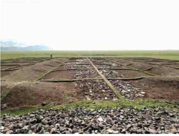
Fot. 8 Bark veya Tapınaktan törensel yolun görünümü (M. Kutlu 2019)