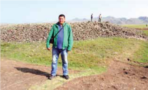
Fot. 3 Eleke Sazı Göktürk Mezar Külliyesindeki incelemelerimiz