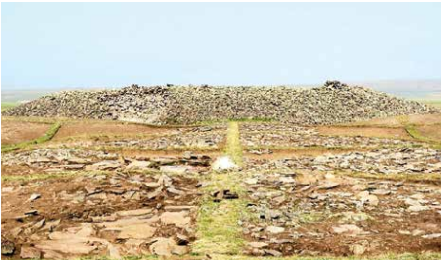
Fot. 7 Eleke Sazı Göktürk Mezar Külliyesi