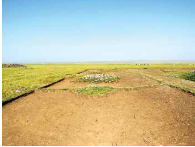
Fot. 10 Mezar külliyesi etrafındaki bazı kurganlar (M. Kutlu 2019)