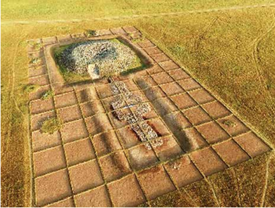
Fot. 6 Eleke Sazı Göktürk Mezar Külliyesi (Самашев ve diğerleri. 2019)