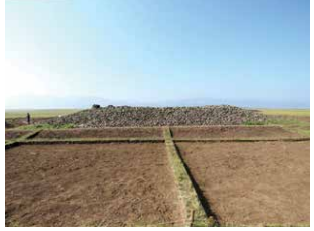
Fot. 9 Bark veya Tapınak etrafındaki duvar (M. Kutlu 2019)