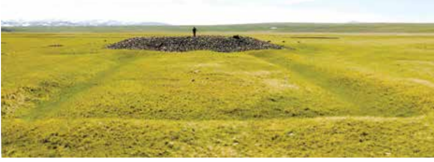
Fot. 5 Kazı öncesi Eleke Sazı Mezar Külliyesi