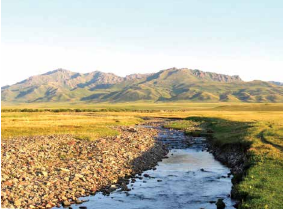
Fot. 1 Tarbagatay Eleke Sazı Yaylası (M. Kutlu 2019)