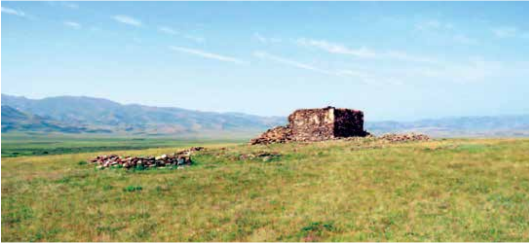
Fot. 2 Eleke Sazı'na ad veren Kazak Beyi Elekenbay'ın mezarı