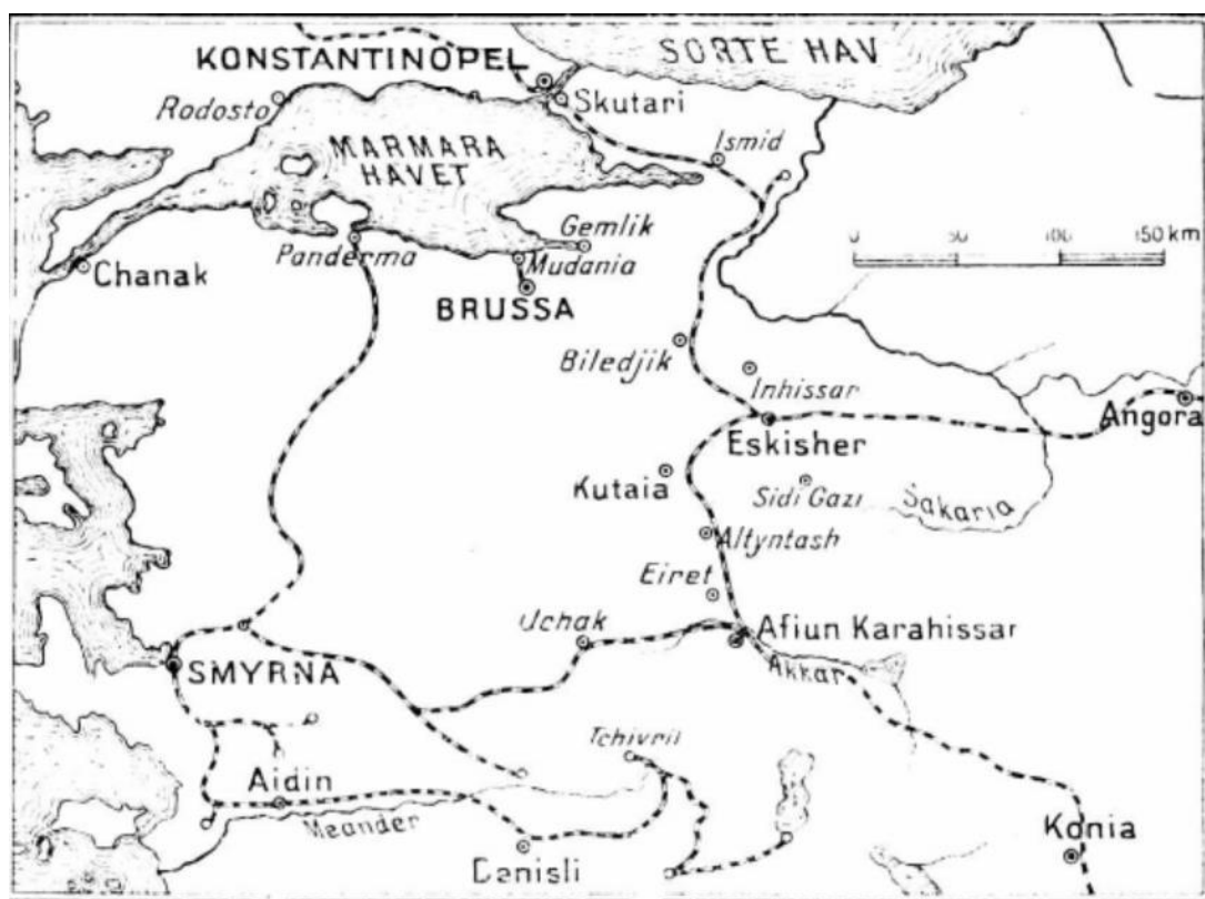
Ek- 1 Harita: Jøhen Nordentoft, Sakarya Meydan Muharebesi askeri haritası 377