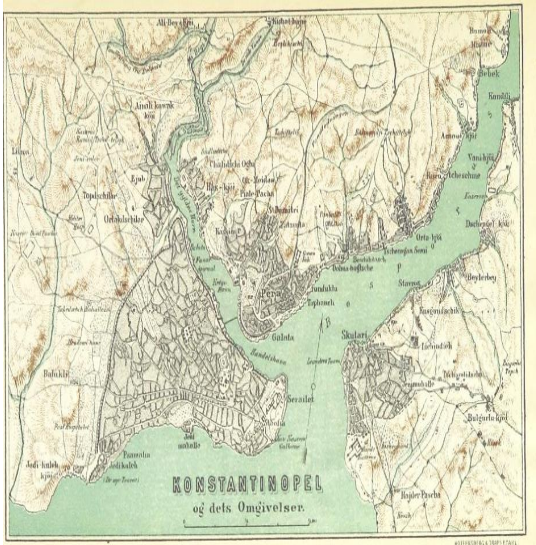
Ek- 3 Harita: Danimarkalı sanatçı ve seyyah Otto Valdemar von Hoskiaer tarafından resmedilmiş olan 1879 tarihli İstanbul ve Çevresi 379