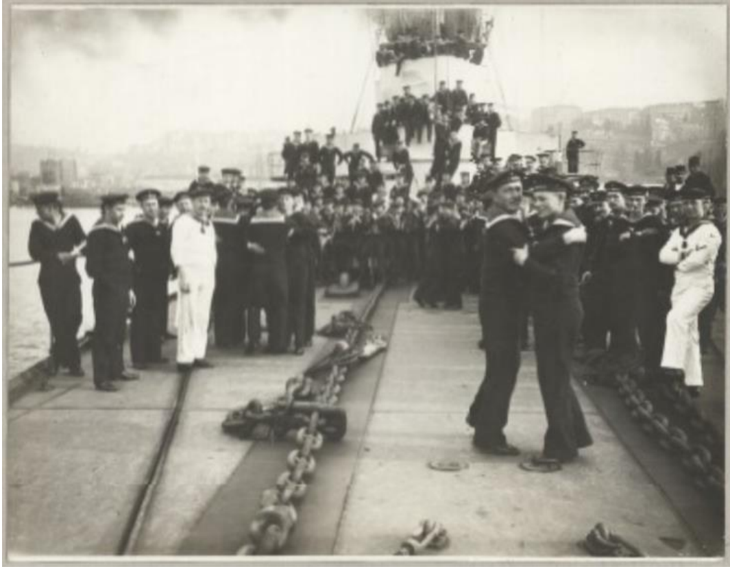
Ek- 7 Fotoğraf: Breslav gemisi önünde denizcilerin fotoğrafı 383