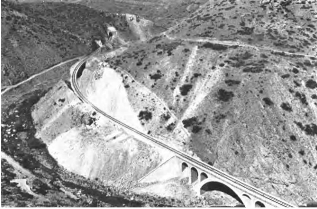
Ek- 5 Fotoğraf: Fevzi Paşa Demiryolu Hattı'nın 204.5. km noktası 381