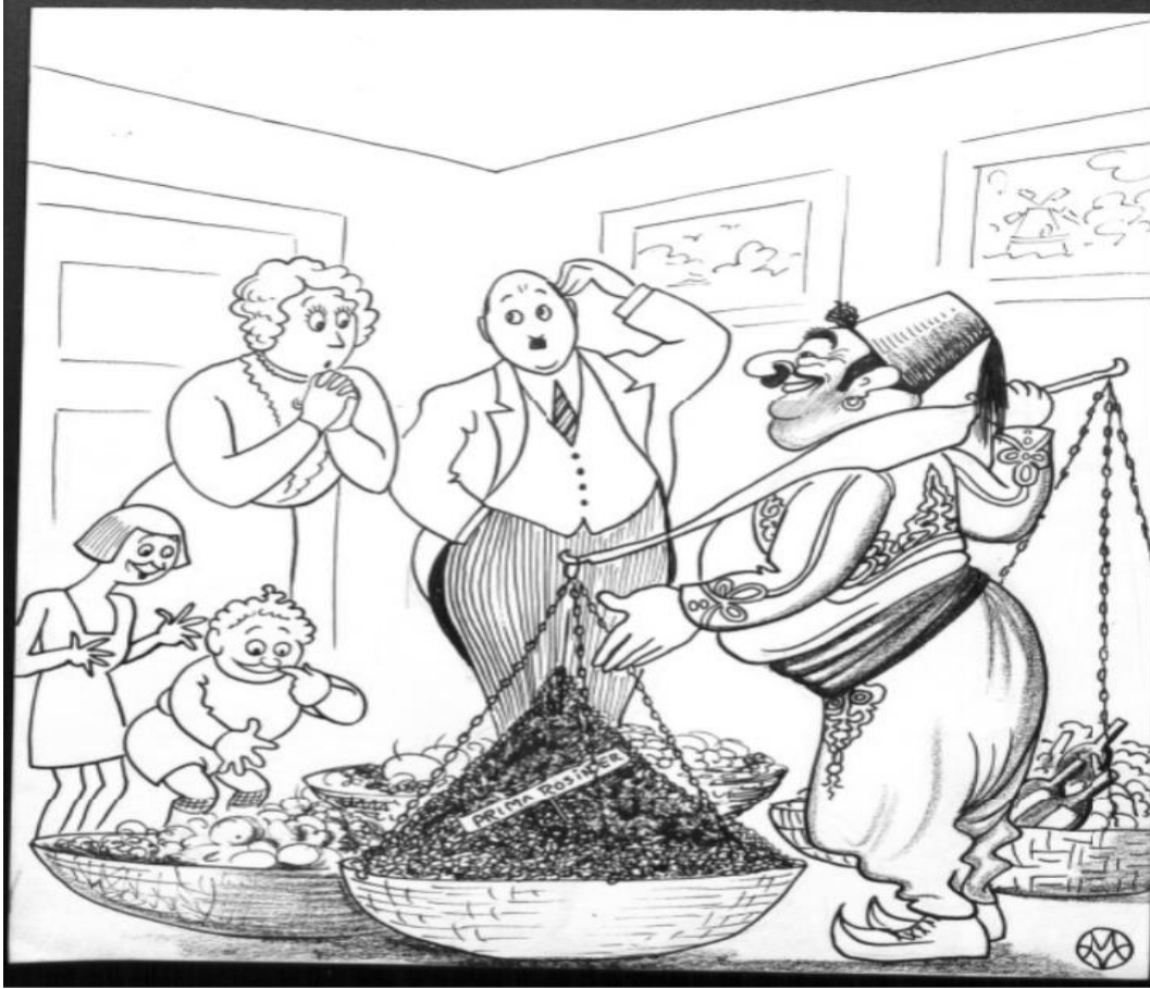
Ek- 15 Karikatür: Bir Türk tüccarın Danimarkalı bir aileyi ziyareti 391