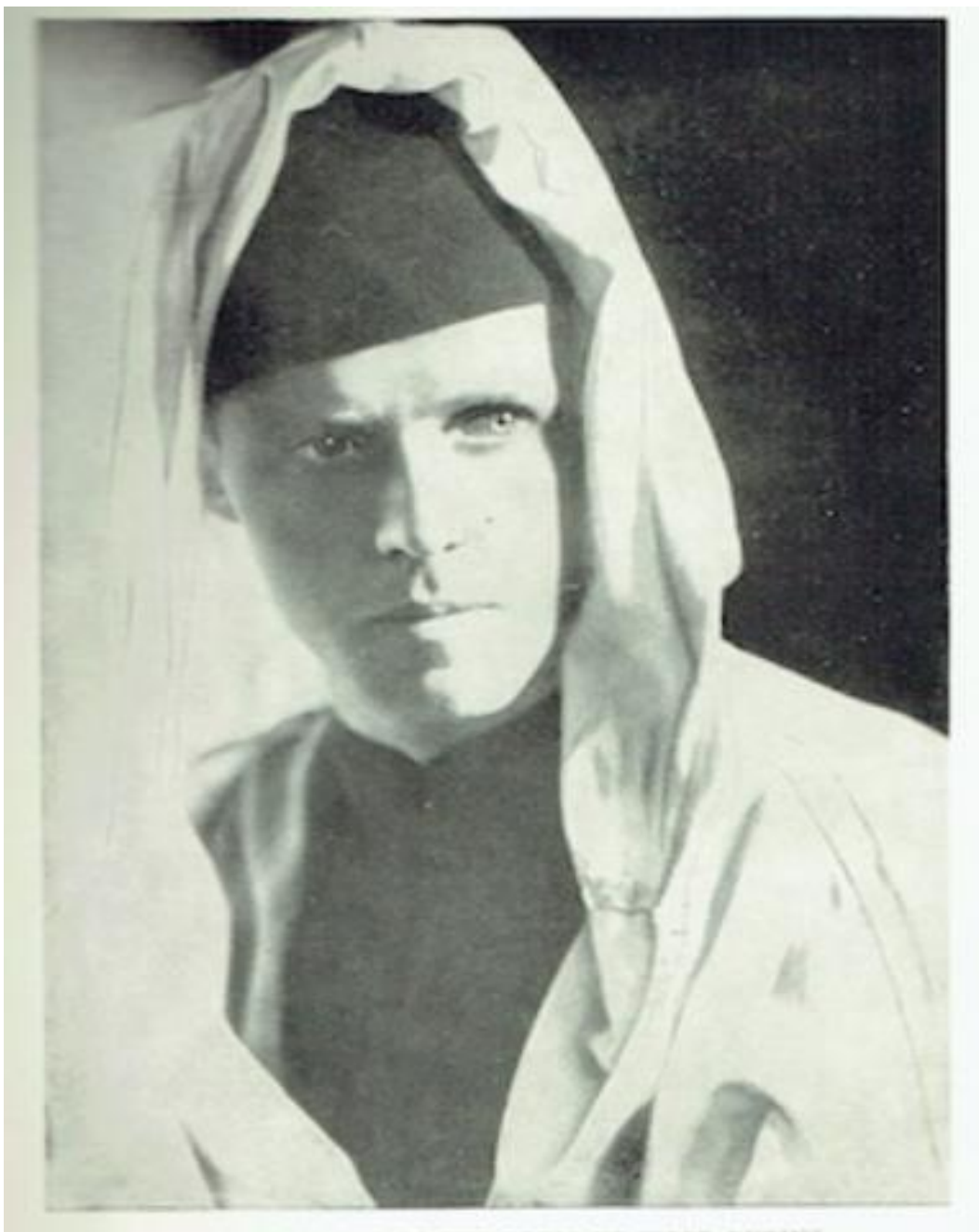
Ek- 14 Fotoğraf: Gazeteci Knud Holmboe'nin fotoğrafı 390