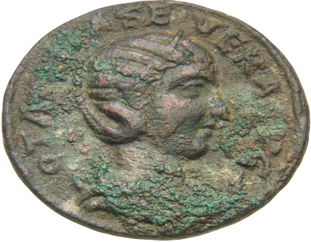
Ek- 6 Fotoğraf: Beyrut Konsolosu Løytved'in Suriye Koleksiyonundan Sikke 382