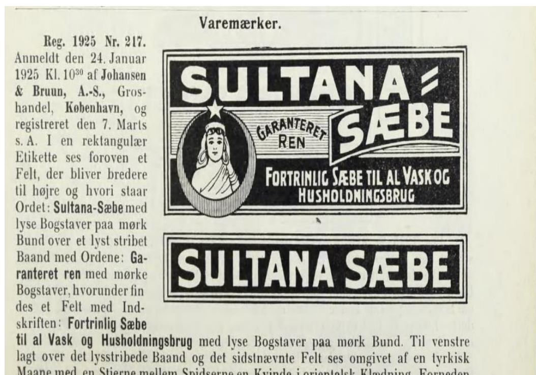
Ek- 16 Fotoğraf: Sultana Sabunu Türk Bayrağı ve Türk kadını logosu 392