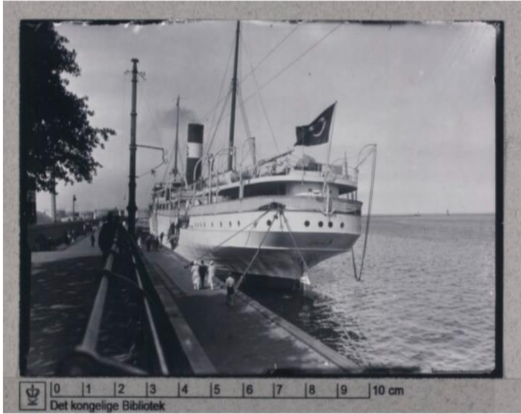
Ek- 10 Fotoğraf: Kopenhag Langelinie Rıhtımında bir Türk Vapuru 386