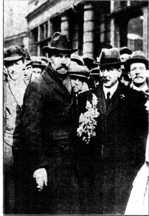
Solda: Venizelos, Sağda: Ramsey Mcdonald ve Lloyd George