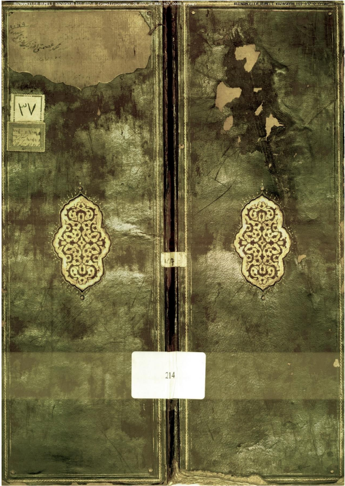
Ek. 1.: Mehmet İsmetî Efendi'ye ait ruznâme defterinin kapak kısmı