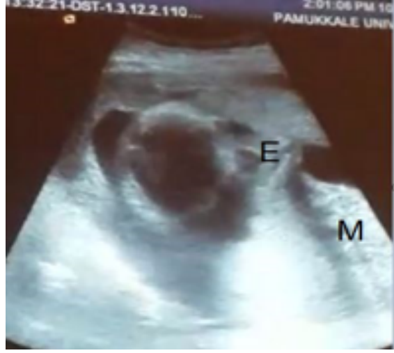
Resim 1b. E: Ektopia kordis, M: Meningomyelosele kesesi.