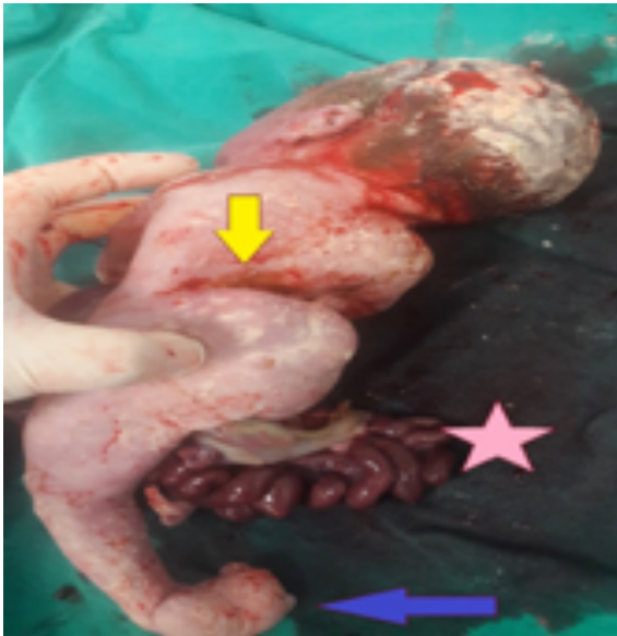
Resim 2b. Sarı ok skolyoz (vertebra anomalisi), Pembe yıldız karaciğer, mor ok pes ekinovarus.