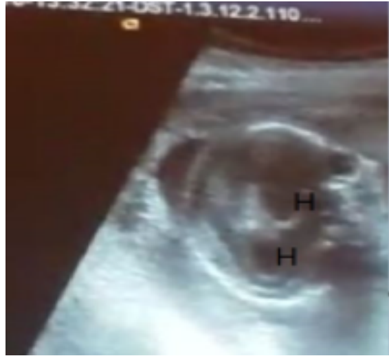
Resim 1c. H: Hidrosefali.

Ex fetusun yapılan makroskopik incelemesinde toraks ve batin ön duvarının tamamen açık olduğu ve bu defektten iç organların protrüze olduğu gözlenmiştir (Resim 2a, 2b ve 2c). Ayrıca vertebral füzyon bozukluğu dikkat çekmiştir. Otopsi ailesi tarafından reddedilen ex fetusa kromozom incelemesi yapılamadı. Takiplerinde komplikasyon gelişmeyen hasta postoperatif 2. günde taburcu edildi.