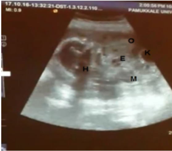
Resim 1a. O: Omfalosel kesesi, H: Hidrosefali, E: Ektopia kordis ve anormal kalp yapısı, K: Anaekoik kistik yapı, M: Meningomyelosele.

incelemelerinde dikoryonik diamniyotik 21 hafta 6 günlük ve 20 hafta 6 günlük intrauterin ikiz canlı gebelik saptandı. Oligohidramniyoz olan fetusta fetal karın ön duvarında geniş bir defektin bulunduğu, karaciğer, mide ve kalbin büyük bir kısmının bu defekt düzeyinde ekstrakorporal yerleşimli olduğu, defektin zarla çevrili olup umbilikal kordun bu kese içinde olduğu, hidrosefali izlendi (Resim 1a, 1b ve 1c). Hastada fetal omfalosel ve ektopia kordis bulguları ile Cantrell pentalojisi düşünüldü. Hastamıza Perinatoloji polikliniğimizde fetosit önerildi. Hastamız gebelik devamını istedi. Başka şehirde ikamet eden hastamız kontrollerine gelmedi. Hasta gebeliğinin 32 hafta ve 4. gününde (02/01/2018) yeniden kuvvetli sancıları ile polikliniğimize başvurdu. Daha önceden de Cantrell pentalojisi olarak tanımlanan fetusta kardiyak aktivite izlenmedi ve ex fetus olarak kabul edildi. Canlı fetusun transvers duruşu nedeniyle kuvvetli kasılmaları olan gebemiz C/S ile doğumunu yaptı. Canlı fetus 1860 gr kız iken, iuex olan fetus 1430 gr erkek görünümündü. Doğumda patolojiye gönderilen plasentalardan canlı fetusun kordonunda 2 arter 1 ven görülürken, ex fetusun kordonunda yalnızca 2 arter içerdiği raporlanmıştır.