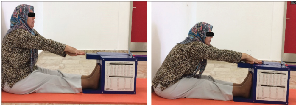
ŞEKİL 2: Otur uzan testinin yapılışı.

Kısa Form-36: KF-36, klinik araştırmalarda sağlık durumunu belirlemek, tıbbi bakımın sonucunu monitörize etmek ve yaşam kalitesini değerlendirmek için kullanılan 36 maddelik 8 alt testten