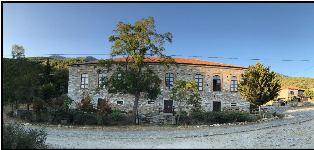
Fotoğraf 6: Doğanbey, Eski Rum Ortaokulu (Bugün Ziyaretçi-Tanıtım Merkezi)