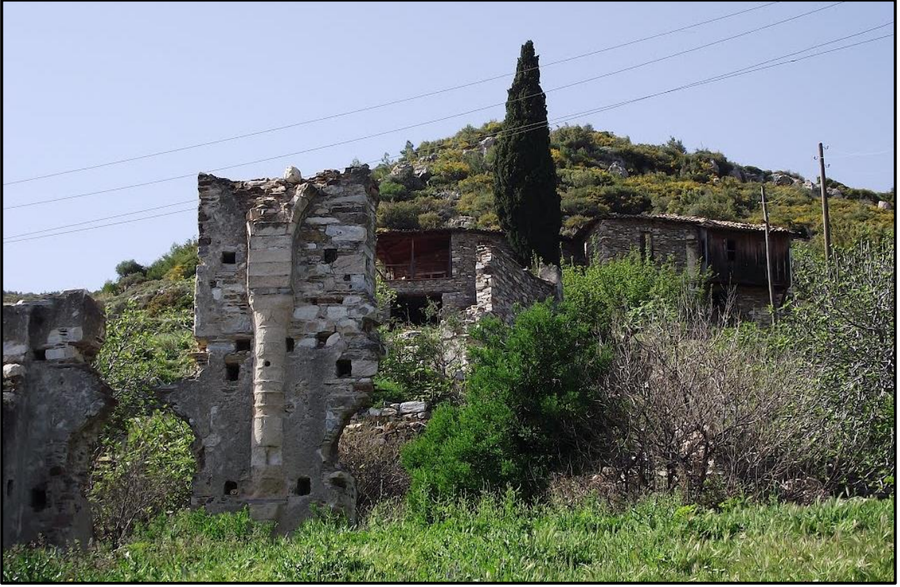
Fotoğraf 2: Doğanbey, Aios Konstantinos Kilisesi