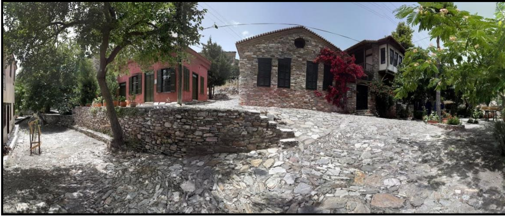
Fotoğraf 5: Doğanbey Köy Meydanı