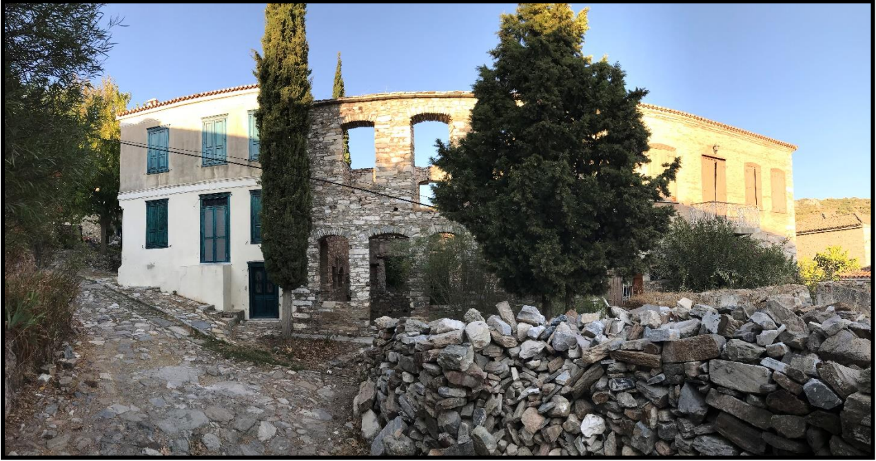
Fotoğraf 8: Doğanbey, Yapılaşma Süreci: Eski Yapı–Yeni Yapı İlişkisi