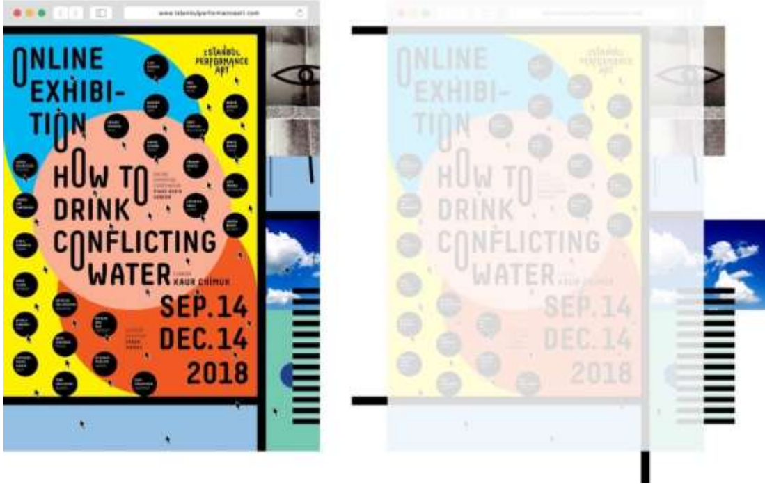
Görsel 1. Tasarımda belirsizlik içererek grafik öğelerin afişin sınırları dışında devam ettiğini örnekleyen afiş tasarımı, Zafer Lehimler, 2018.

Görsel 1’de izlendiği gibi; açık kompozisyonu örnekleyen bir afiş tasarımı açısından sınırlı yüzey dışında devam eden grafik öğe belirsizlikleri, tamamen izleyene göre değişkenlik gösteren bir algılamayı kapsamaktadır. Örneğin Görsel 1 sol taraftaki afişi izleyen bir kişi Görsel 1’de sağ tarafta tasarıma yansıtılan her iki fotoğrafın sonsuz bir düzlemde devam ettiği yanılgısına kapılabilirken başka bir izleyen bu fotoğrafların afişin sınırıyla son bulduğunu ya da afişin sınırı dışında az bir oranda dışarıda devam ettiğini düşünebilir. Yanılsamayı kapsayan bu tür değişken algılamaların, açık kompozisyon açısından daima var olacağı gerçeği unutulmamalıdır. Bir afiş yüzeyi başarılı bir şekilde tasarlanmaz ise görsel iletişim açısından dikkat çekmez. Dikkat çeken bir afiş zihnimize yer edinerek bizi etkileyebilir (Landa, 2011: 172). Afiş tasarımı açısından başarılı bir açık veya kapalı kompozisyona etken olan şey, tasarım yüzeyinin başarılı bir şekilde organize edilmesidir. Afişin içerdiği bilgiye yönelik tipografi, illüstrasyon, fotoğraf, geometrik/organik biçim, renk gibi her türlü grafik öğe arasında uyumlu bir birlikteliğin sağlanmasıdır. Elde edilen görsel tavır, kompozisyon açısından değer taşıyarak mesajın vurgusunu güçlendirecektir.