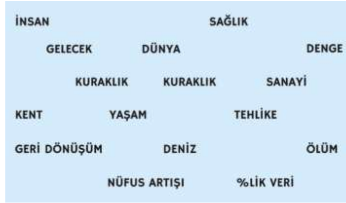
Görsel 1. “Su” temalı bir afiş tasarımı açısından yaratıcı fikre yön verecek anahtar kelimeler.

yoğunlaşan tasarımcı, etkili bir yaratıcı fikir açısından çok yönlü araştırma yapmalıdır. Araştırmada elde edilen yazınsal/görsel bilgiler tasarım probleminin tanımlanması ve yaratıcı fikrin olgunlaştırılmasına ışık tutacaktır. Örneğin, “su” temalı sosyal içerikli bir afiş tasarımı açısından bilimsel toplantı çıktıları, istatistiksel veriler veya kurum ve kuruluşlara ait web siteleri üzerinden elde edilecek veriler afişin tasarım sürecine yön verecek anahtar kelimelerin belirlenmesini sağlayabilir. Görsel 1’de yer verildiği gibi “su” temasından hareketle incelenen anahtar kelimeler; afişte vurgulanmak istenen mesaj açısından içerik ve biçim etkileşimine katkı sunabilir.