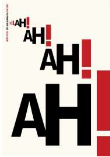
Görsel 7. “Sil-ah”, Savaş Çekiç, 2009.

afişteki içerik ve biçimin kapsamına girebilir. Görsel 7’de yer verilen tipografik afiş, silah kullanımının yıkıcı etkisi karşısında bireysel silahsızlanmaya yönelik “acı”, “keder”, “ölüm” ve “pişmanlık” gibi sözcüklerle ilişkilenebilen “Ah”! sözcüğüne vurgu yapmaktadır. Bu sayede tasarımda sil-ah! hecelemesi kültürel etkiye yönelik uyarıcı bir mesaja dönüşerek insanın yaşamında silahı silmesi gerektiği vurgusudur.