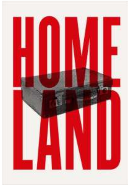
Görsel 4. “Vatan”, Michele Santella, 2019.

Grafist 20 kapsamında gerçekleştirilen “sınırları geçerken...” projesi gerçekleştirilmiştir. “Üniversitelere ve tasarımcı örgütlerine çağrı yapıldı; öğrenciler ve profesyonel tasarımcılar, yüzyılımızın en can yakıcı sorunu konusunda yaratıcı fikir üretmeye davet edildiler” (Karamustafa, 2016: 4). Öğrenci sergisinin için gönderilen tasarımlar içerisinde büyük ödüle layık görülen Görsel 4’teki afiş tasarım, yaratıcı fikrin içerik ve biçimle olan ilişkisini örneklemektedir. Vatan (Home Land) isimli bu afişte biçimsel öğe olarak tipografi ve fotoğrafın içerikle olan metaforik bağı, vatanından ayrılmak zorunda kalan mülteci sorununa dikkat çekmektedir.