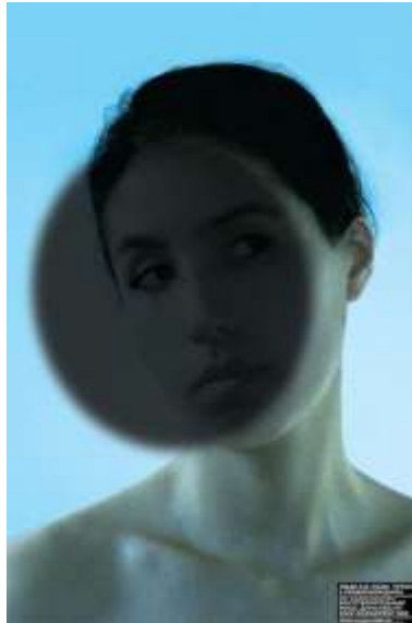
Görsel 6. “Down Sendromu”, Alain Le Quernec, 2006.

Görsel 6’da Rusya’da down sendromuyla mücadele eden bir dernek için Alain Le Quernec tarafından tasarlanan sosyal içerikli bir afiş yer almaktadır. “Down Sendromu” isimli bu afişte biçimsel yapıya yönelik ay tutulması ve kadın fotoğrafı ile down sendromuna gönderme yapan yaratıcı fikir, tasarımda içerik ve biçim arasındaki ikili etkileşimi örneklemektedir.