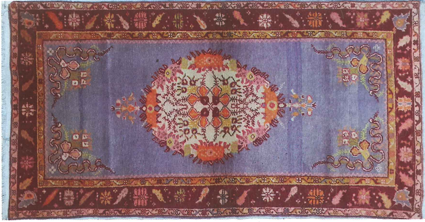
Fotoğraf 25. Köşe-göbekli divan halısı, 1960, 102x202cm Güney, Özel Koleksiyon, (Kahvecioğlu Sarı, 2018)

Fotoğraf 25’de görülen köşe-göbekli divan halısı Gördes (Türk) düğümlü, dm 2 ’de düğüm sıklığı 28x32, renkleri kırmızı, sarı, krem, pembe, turuncu, siyah, mavidir.