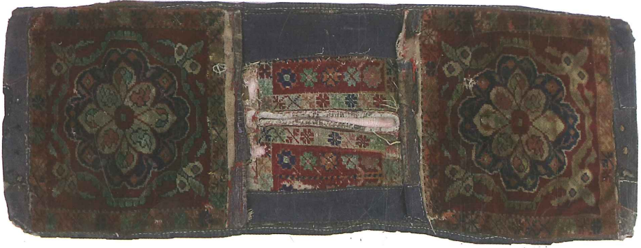
Fotoğraf 27. Halı heybe, 1922, 49x134 cm Güney, özel Koleksiyon, (Kahvecioğlu Sarı, 2018)

Fotoğraf 27'de görülen halı heybenin saraçlı at heybesi olduğu ifade edilmiştir. Heybe gözü (enxboy) 49x50 cm, heybenin orta yarık kısmının uzunluğu 30 cm kenarları saraçlı heybe oldukça yıpranmış durumdadır. Gördes Türk düğümü ile dokunmuş, dm 2 'de düğüm sıklığı 32x34, renkler bordo, krem, lacivert, kahverengi, haki, açık yeşil, koyu yeşil, mavidir.