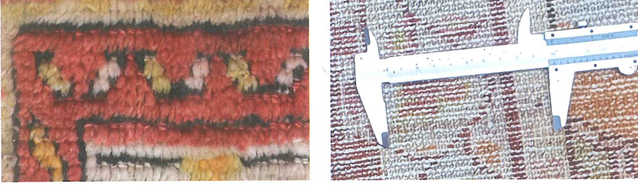
Fotoğraf 3. a) Halı yüzü-Türk düğümü, b) halı tersi-düğüm sıklığı detayı (Kahvecioğlu Sarı, 2018)

söylenbilir. Halıların yan kenar örgüsü iki çift çözügünün ara atkı ipliğiyle alt-üst geçirilip sarılarak yapıldığı, bazılarında ise zemin renginde ayrı bir yün iplikle ara atkıya kenetlenerek kenar örgüsü yapıldığı görülmüştür. Çiti ve halı kilimi ise atkı ipliği ile düz dokuma yapılmıştır. Halı saçakları başlangıçta kısa ve bitişte daha uzun olup, sadece düğümlenerek bırakılmıştır.