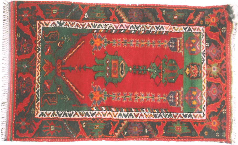
Fotoğraf 14. Halı namazlağı, Çal ilçesi, Süller Kasabası, 120x90 cm 2 . (Soysaldi, 2006).

Fotoğraf 14'de görülen halı seccade bir geniş bir ince kenar suyu ile çerçevelenmiş zemini mihrap desenlidir. Geniş kenar suyu S kıvrımlı dal bağlantılı asimetrik, yalın biçimlendirilmiş rumi, hataî ve tırnaklı yapraklardan oluşmaktadır. Bu kenar suyu da yörede yaygın bezemelerden olup Gördes halı bordürlerinin kökleri veya kötü kopyaları mı sorularını akla getirmektedir. Beyaz renkli ince kenar suyunda Oğuz boylarından salgur(salur ۸) damgası çift yönlü sıralıdır (Atalay, 1992: 56).