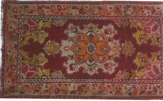
Fotoğraf 21. Köşe-göbekli divan halısı, 1945, 95x156 cm 2 . Güney, Özel Koleksiyon, (Kahvecioğlu Sarı, 2018)

1640 tarihli Narh(Fiat) defterlerindeki Uşak halıları listesinde “Kırmızı üzerine ortası sofralu kaliçe” olarak, Köşe-göbekli(madalyonlu) halılardan bahsedilmektedir (Küçükerman, 1990:32). Ayrıca bazı arşiv belgelerinde, Uşak halılarının islahı amacıyla 1890'lı yıllarda Bursa'daki Camilerden 500 yıllık halıların Uşak üretimine örnek olması için toplandığı bahsedilmektedir. Ancak bu gibi tedbirlerin Uşak çevresindeki halılarda geri dönüşü sağlayamadığı (Ürer 2007:144) ifade edilmektedir. Uşak halılarındaki bu yozlaşmanın yerel halı üretimini de etkilediği ve Güney halılarındaki yerel bezemelerin yerini Avrupa zevkini yansıtan bezemelerin aldığı söylenebilir.