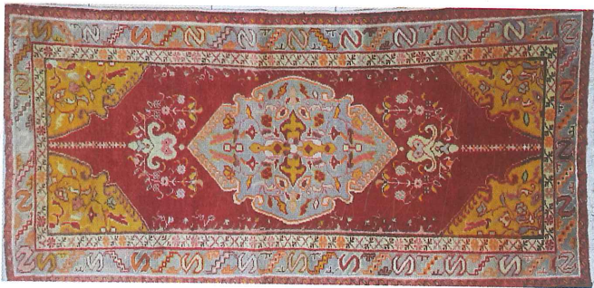
Fotoğraf 19. Köşe-göbekli divan halısı, 1946, 108x215 cm 2 . Güney, Özel Koleksiyon, (Kahvecioğlu Sarı, 2018)

Bu halının bir benzeri Uşak Çakaloz Camisinde tespit edilmiş ince kenar suları ve köşe-göbek aynı olmakla birlikte, geniş kenar suyu farklıdır (Ürer, 2007:120). Bu halı desen ve renk özellikleriyle Güney halısı özelliği göstermektedir.