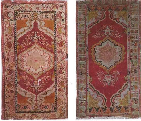
Fotoğraf 22. Köşe-göbekli divan halısı, 1933 ve 1940, Güney, Özel Koleksiyon, (Kahvecioğlu Sarı, 2018)

Fotoğraf 22.'de görülen köşe-göbekli divan halıları Gördes (Türk) düğümlü olup, her ikisinin de dm^2 'deki düğüm sıklığı 28x34, hayli eskimiş ve solmuş olan renkler kırmızı, sarı, krem, turuncu, siyahtır.