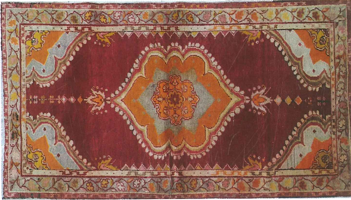
Fotoğraf 23. Köşe-göbekli divan halısı, 1961, 97x174 cm Güney, Özel Koleksiyon, (Kahvecioğlu Sarı, 2018)

Halılardaki ince kenar suları mine çiçekli, geniş kenar suyu soldakinde S kıvrımlı dal, karanfil motifleri, sağdakinde ise çiçek açmış bitki ve aralarında yalın hayat ağacı motifleri sıralıdır. Halılarda zemin deseni aynı olup, simetrik \frac{1}{4} rapor tekrarıdır. Bu göbek kenarları dendanlı, ortası sekiz köşeli, iki ucu lâle biçimli salbek ve çiçekli bahar dalları sarkmaktadır. Merkezde tam, köşelerde aynı göbek motifinin \frac{1}{4} 'ü yer almaktadır.