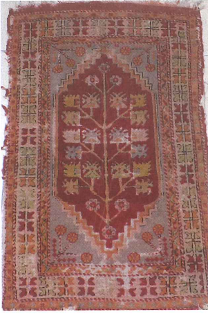
Fotoğraf 16. Hayat ağaçlı Seccade örnekleri Çal halısı, 1939, 84 \times 129 cm^2 .

kırmızı, turuncu, krem, açık yeşili, siyah, açık mavi, hardal sarısıdır. Güney halısı dm^2 de 28 \times 28 düğüm sıklığı olup, Türk düğümü ile dokunmuştur. Halıda abraj, kenarda marullanma, halının üst kenar ile alt kenar genişliği arasında 8 cm fark gözlenmiştir. Bu durum halının ticari bir kaygı ile dokunmadığını aile ihtiyacı olarak ve acemi biri tarafından dokunduğunu göstermektedir. Renkleri; kırmızı, sarı, krem, pembe, şeker pembe, turuncu, kahverengi, mor, açık mavi, fıstık yeşili olarak gözlenmiştir.