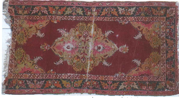
Fotoğraf 18. Köşe-göbekli divan Halısı, 1935, 88x160 cm 2 . Güney, Özel Koleksiyon, (Kahvecioğlu Sarı, 2018)

Fotoğraf 18'de görülen halı Türk-Gördes düğümü ile dokunmuş, dm 2 'de düğüm sıklığı 26x38, renkleri kırmızı, sarı, turuncu, krem, pembe, siyah ve açık yeşildir. Dış kenarda devecik suyu, aradaki geniş kenar suyunda kozalak biçimli simetrik yaprak ortasındaki dal ucu Salur damgası ile süslüdür. İnce iç kenar suyu üsluplaşmış dört yapraklı çiçek yangışlıdır.