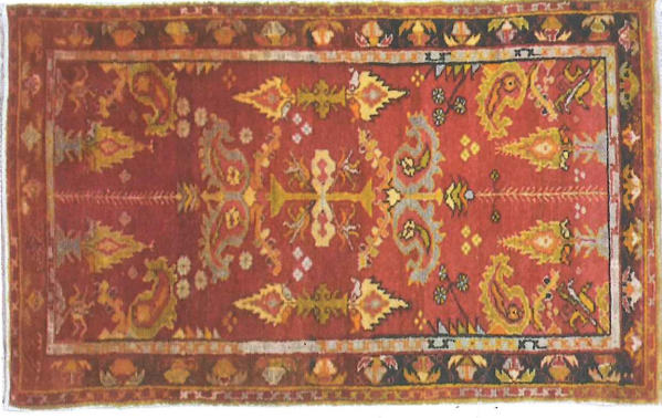
Fotoğraf 13. Divan Halısı, Boynuz-şal ve Şamdan motifli, 1950, Özel Koleksiyon, (Kahvecioğlu Sarı, 2018).

Fotoğraf 13'te görülen boynuzlu divan halısı Türk-Gördes düğümlü ve dm^2 deki düğüm sayısı 30 \times 38 'dir. Halının yarısından itibaren kenar suyu zemini ve motif sınır(kontur)larında renk değişikliği gözlenmiştir. Halının renk dağılımı kırmızı, yeşil, siyah, mavi, sarı, turuncu, kahverengidir.