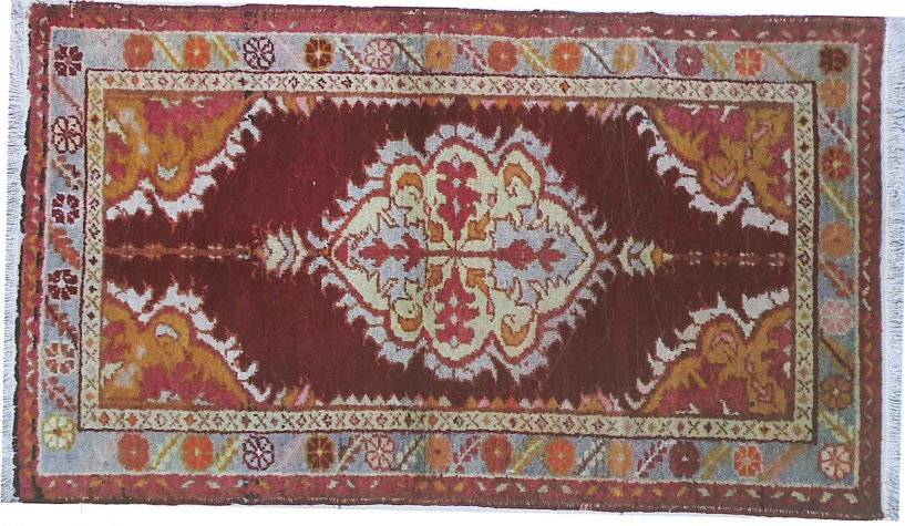
Fotoğraf 24. Köşe-göbekli seccade halısı, 1965, 79x140cm Güney, Özel Koleksiyon, (Kahvecioğlu Sarı, 2018)

Fotoğraf 24'te görülen seccade halısı Gördes (Türk) düğümlü, renkleri kırmızı, pembe, sarı, kahverengi, açık mavi ve beyazdır. İki ince kenar suyunun sınırladığı geniş kenar suyunda rozet çiçekleri ve meşe yaprakları bağlantılı sıralanmıştır. Zemin deseni köşe-göbekli ve \frac{1}{4} simetrik raporludur. Göbek merkezinden çıkan sekiz yöndeki dallar stilize çiçek ve yaprak dolgulu, kenarları dendan sınırlı ve tırnaklı yapraklıdır. Köşe motiflerinin uzantıları yan kenarlarda muska yangışlarıyla süslenmiştir. Bu halıdaki göbek dolgu motifleri ile cıngılı Çal halılarındaki göbek dolgu motifleri arasında yakın benzerlik görülmektedir (Fotoğraf 8,9,11).