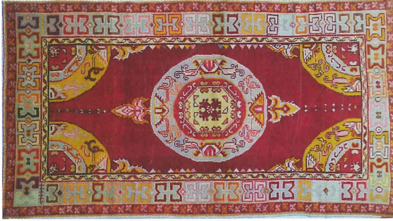
Fotoğraf 20. Köşe-göbekli divan halısı, 1958, 105x190 cm Güney, Özel Koleksiyon, (Kahvecioğlu Sarı, 2018)

Kaynak kişi Ezgin'in (Sözlü görüşme: 14.12.2018) ifadesine göre bu halılara "goblen modeli" adı verilmektedir. Goblen modelinin Batı Anadolu'da üretilen İngiltere kaynaklı sipariş halı desenlerinin devamı olduğu düşünülmektedir.