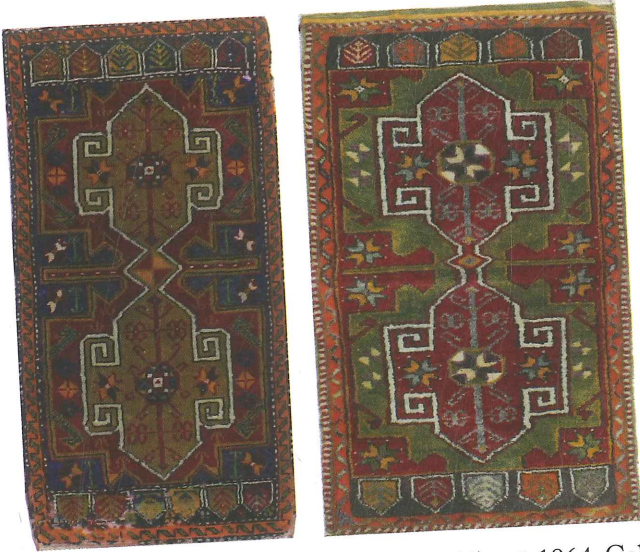
Fotoğraf 5. Halı Yastık, sepetli yangış, sol;1935, sağ;1964, Çal-Süller (Kahvecioğlu Sarı, 2018).

“Denizler yastığı” olarak tanınan halı çifti \frac{1}{4} desen raporlu olup, tek kenar suyu ile çerçevelenmiştir (Fotoğraf 4). Merkezden açılan sekiz kollu yıldız çevreleyen göbek de sekiz kollu yıldız biçimlidir. Yıldız göbek dört ana yönünde hayat ağaçları dalları, ara yönlerde de paralel çizgilerle süslenmiştir. Bu göbek motifinin uzantıları ise bıtıraklı göz motifleri ile tamamlanır. Köşebentlerde geometrik biçimlerin içi muska (dua nüshası) motifleriyle doldurulmuş ve uçları kazayağı yangışlıdır. Bu köşe motifi Döşemealtı halılarında “heybe köşesi” olarak bilinir (Soysaldı, Aral, 2015:1534; Zaimoğlu, Teker, 2013: 187). Yastığın kenar suyu iki dişeme sınır arasında, üsluplaşmış ucu tomurcuklu yaprak ve yatık S kıvrımlı Üregir-Yüregir damgasına (Atalay, 1992:57) benzer yangışlarla bezenmiştir. Ayrıca iki uçta gözlü beneklerin sıralandığı kısa kenar suyu da yer almaktadır.