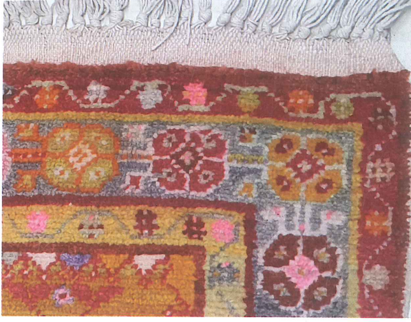
Fotoğraf 2. Güney, halı kilimi, kenar örgüsü dokuma detayı (Kahvecioğlu Sarı, 2018).