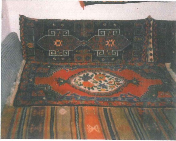
Fotoğraf 1. Minder ve yastık halısı, Çal-Süller (Soysaldı 2007:833).

Geleneksel Türk hayat tarzında olduğu gibi, Denizli'deki geleneksel evlerde döşeme malzemesi olarak halı-kilim gibi dokuma yaygı ve mefruşat eşyalar kullanılır. Hayat denilen sofa ve odalarda minder veya maket adı verilen divan-sedir üzerine halı serilir ve duvara halı yastıklar dayanır. Bu düzen halı yastıklar üzerine örtülen dantelli, kanaviçe işlemeli örtüler ve maket eteği ile tamamlanır.