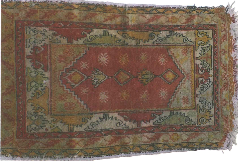
Fotoğraf 15. Halı namazlağı, 1970, 79x136 cm 2 . Çal, Özel Koleksiyon, (Kahvecioğlu Sarı, 2018)

Fotoğraf 15.de görülen halı Türk-Gördes düğüm tekniğinde dokunmuştur. renkleri; kırmızı, sarı, turuncu, krem, fıstık yeşili, siyahtır. Halı secade dört adet kenar suyu ile çerçeveselenmiştir. İki ince, kenar suyu eğri yangış da denilen sığır sidiği, aradaki geniş kenar suyu S kıvrımlı yapraklı çiçek bezemelidir. İçteki beyaz zeminli geniş kenar suyunda çift yönlü eli belinde motifi görülmektedir. Bu motif Döşemealti halılarında Nacak olarak bilinmektedir. Halı zemininde orta eksende esas yangış olarak birbirine ekli alev biçiminde, içi Oğuz boylarından salgur(salur ı) damgası yer almaktadır (Atalay, 1992: 56). Ayrıca zemin ve köşe boşlukları bitirak yangışlarıyla doldurulmuştur. Seccadenin mihrap üstünde sarı, alt köşeliklerde beyaz zemin rengi, secde yönünü belirlemek için olsa gerektir.