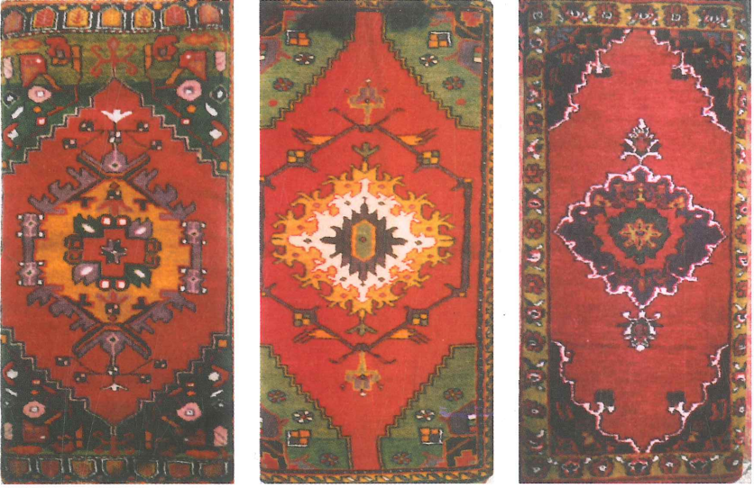
Fotoğraf 6. Köllü(göllü) halı yastıklar, 20. Yy. ilk yarısı, Çal-Süller (Soysaldı, Paksoy, 2006:830).

Göllü (Köllü) Yastıklar; Türkçede K ve G sesi farklı ağızlarda birbirinin yerine kullanılmaktadır. Ortada yer alan göbek (madalyon) yangışına Çal'da olduğu gibi Kütahya yöresinde de köllü-göllü denildiğine rastlanmıştır. Bu yastıklarda hâkim zemin rengi kırmızı olup, köşebent ve kenar sularında lacivert, yeşil ve sarı da en göze batan renklerdir. Bu renkler Türk devletlerinin bayraklarında da hâkim olan renklerdir.