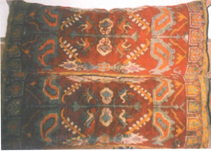
Fotoğraf 7. Halı yastık, boynuzlu yangış, 20.yy. ortası, Bekir Koyu evi, Çal-Hançalar (Soysaldı, Paksoy, 2006: 829).

Sağdaki yastık zikzaklı (sığır sidiği-eğri yangış) bir kenar suyu çerçeveli olup, zemin \frac{1}{4} (köşe göbek) raporludur. Gölünün merkezindeki göz motifini tırnaklı kahverengi, beyaz (doğal ak yün) ve sarı renkli dendanlı renk dalgaları çevrelemektedir. Bu gölün altıgen bir çerçevesi ve üzerindeki yalın bezemeler zemin boşluğunu süslemektedir. Köşebentler basamaklı kenarlıkla sınırlanmış, içleri de göncagül ve rozet çiçekleriyle doldurulmuştur.