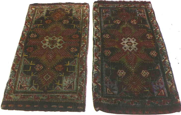
Fotoğraf 4. Halı Yastık, 1940, Çal-Denizler, (Kahvecioğlu Sarı, 2018)

Denizler kasabasında dokunan bir çift yastık halı İran (Isparta) düğümüyle dokunmuş, renkleri ise; bordo, kırmızı, krem, siyah, turuncu, hardal sarısı, mor ve açık mavi olarak gözlenmiştir.