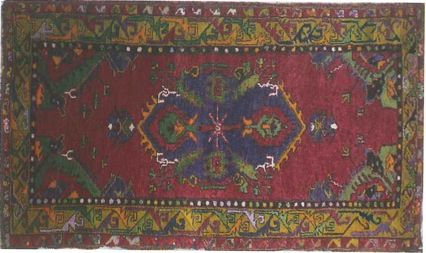
Fotoğraf 9. Divan (cıngıllı) halısı, 1968, Çal, Özel Koleksiyon, (Kahvecioğlu Sarı, 2018).

Fotoğraf 9’da görülen yörede sık rastlanan ve Çal’ın cıngıllı halısı olarak bilinen halılardandır. Dm 2 deki düğüm sayısı 31x33, Türk (Gördes) düğümü ile dokunmuştur. Halı bordo, krem, fıstık yeşili, siyah, lacivert, turuncu, pembe ve mor, hardal sarısı renklerde. Bu maket halısı üç kenar suyu ile çerçeveslenmiş, zemini ise ¼ simetrik rapor tekrarludur. Birimler antinaturalist yaklaşımla biçimlendirilmiştir.