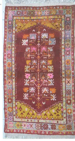
Fotoğraf 17. Hayat ağaçlı Seccade Güney halısı 1959, 101 \times 174 cm^2 . Özel Koleksiyon, (Kahvecioğlu Sarı, 2018).

Her iki halının teknik özellikleri aynı olmakla birlikte Çal örneği çok kullanılmış ve eskimiş olmasının yanında renkleri de solmuştur. Benzer renklere sahip örnekler renk parlaklığı ve solmanın derecesini göstermesi bakımından önemlidir.