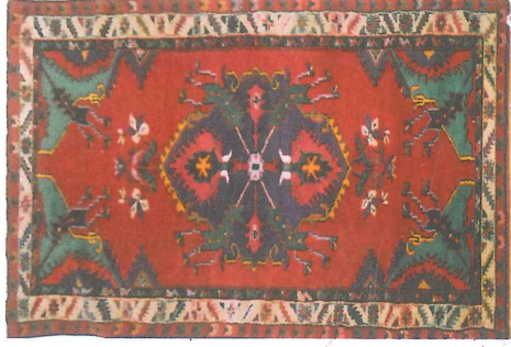
Fotoğraf 11. Çal-Süller maket (çingilli) halısı, (Soysaldı, Paksoy, 2006)

Çingilli (Çingilli) Göbek: Zemin deseni yörede “çingilli halı” olarak ün salmış köşe- göbekli halı biçimindedir. Bu halı göbeği merkezinde sekiz kollu yıldız ve bu kollardan dört ana yöne yalın hatlı tarzı çiçekler ile ara yönlere tırnaklı hançer yapraklar görülür. Bu yapraklardan üçer adet uçları tomurcuklu sarkıklar çıkar ki bunlar halıya çingilli-çingilli adını vermektedir. Bu göbeğin dikey yöndeki iki ucunda da süsleme sanatlarında salbek denilen üsluplaşmış çiçekler görülür. Bu halılarda çingilli göbeğin \frac{1}{4} 'ü köşelerde yer alır (Fotoğraf 8,9,11).