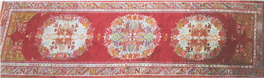
Fotoğraf 26. Köşe-göbekli yolluk halısı, Güney, özel Koleksiyon, (Kahvecioğlu Sarı, 2018)

Ayrıca Fotoğraf 26.’daki yolluk halının zemini bir önceki halının aynı deseni olan, çiçek buketli üç göbek ve köşeleri kurdela bağlı buketlerle süslenmiştir. Bu halının kenar suyu ise fotoğraf 19’da ki divan halısının aynıdır. Güney halılarındaki kurdele bağlı buketler 19. yüzyılda Batı etkisiyle dokunan halı desenlerinden biri olabileceğini düşündürmektedir.