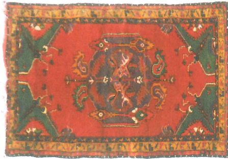
Fotoğraf 12. Çal-Süller maket (Boynuzlu) halısı, Denizli Çal-Süller (Soysaldı, Paksoy, 2006)

Boynuzlu (Çal desenli) Göbek: Çal halısı olarak bilinen çingilli halılarda görülen ikinci göbek örneği ise “boynuzlu” olarak adlandırılır. Bu göbek renk ve biçimlerinde bazı farklılıklar olmasına rağmen ana kurguda \frac{1}{4} simetrik düzenlenmiştir. Zemin göbeğinde dikey orta eksenindeki daldan simetrik çıkan üsluplaşmış çiçek, meşe yaprakları ve “boynuz” adını veren kenarları tırnaklı iki hançer yaprak ve yanlarda iki yönlü şamdan motiflerinden oluşmaktadır. Kenarlarda şamdanları içine alan sınırlarla göbek zemini mor renkli doldurularak göbek oluşturulmuştur.