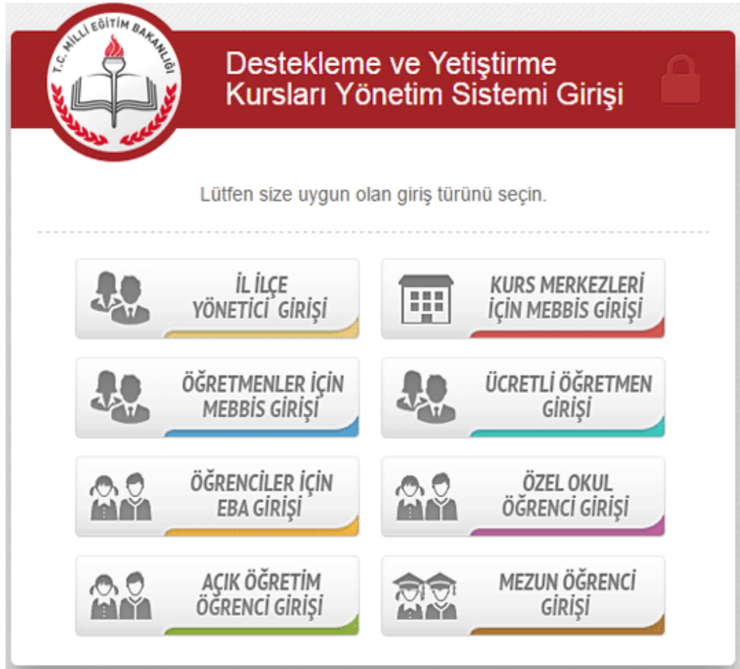
Şekil 2.1. Destekleme ve Yetiştirme Kursları Yönetim Sistemi Girişi

Aşağıdaki şekilde üzerinde destekleme ve yetiştirme kursları yönetim sistemi girişinin görüntüsü yer almaktadır.