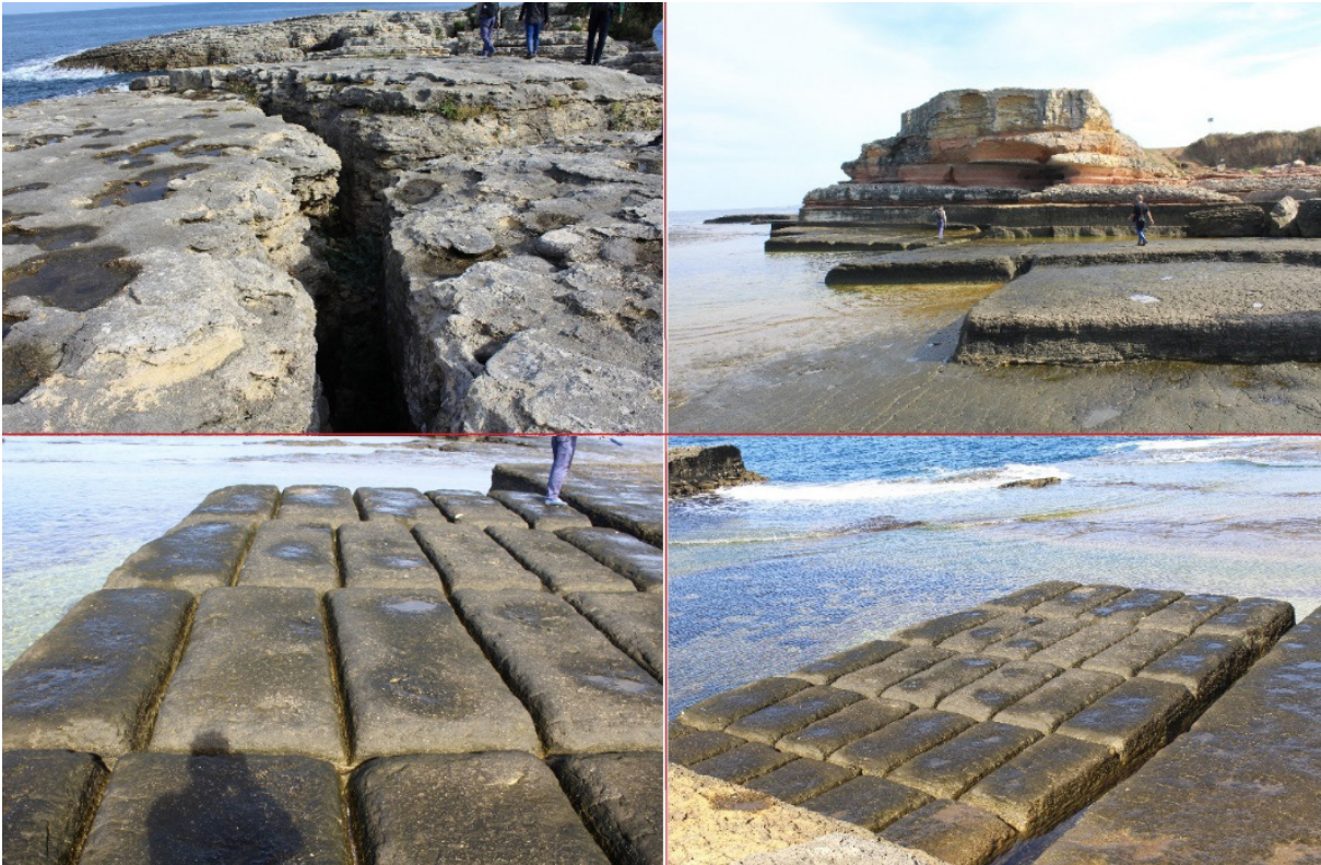
Fotoğraf -1: Çalışma alanındaki birinci lokasyonda bulunan ve Osmanlı döneminde özellikle Rumeli Hisarı'nın inşasına yönelik kullanılan taş ocağı.

Rumeli Hisarı'nın inşasında kullanılmak üzere İstinye ve Kefken'den denizyolu ile Boğaziçi'ne taş taşındığı bilinmektedir (Göncüoğlu, 2016). Özellikle 15.yy'da başta İstanbul olmak üzere çevrede bulunan yerleşmelerin yapı malzemesi önemli oranda bu kıyılardan temin edilmiştir. Çalışma alanında bazıları su altında kalmış, deniz seviyesinden 10 m ye kadar yükselen (Fotoğraf – 1a) düz ve/veya çapraz tabakalı ya da laminalı görünüme sahip eolinitlerin düzenli bir şekilde ve bloklar halinde kesilmiş olduğunu gösteren izler halen mevcuttur (Fotoğraf – 1b). Ortalama olarak genişliği ve derinliği 75 cm, uzunluğu ise 150 cm olan blokların eski ölçülere göre mimar arşını ile 1x1x2 arşın olarak tasarlandığı düşünülmektedir. Kesimi kolaylaştırmak için açılan su kanalları ile kesilen blokları teknelere taşımak için kullanılan havuzları ve su yollarını da hâlihazırda görmek mümkündür. Bu yönüyle değerlendirildiğinde hızlı, bol ve düzgün malzeme kaynağı sağlayan eolinitlerin Rumeli Hisarı'nın hızlı bir şekilde tamamlanmasına katkı sağladığı söylenebilir (Fotoğraf – 1c). Günümüzde de bu işleme müsait kayalıklarda yapılaşma izleri bulunmaktadır (Fotoğraf – 1d). Ayrıca bölgenin halen turistik bir mesire alanı olarak kullanılmasından ötürü, kirletic ve deforme edici anlamda insan etkisi özellikle yaz aylarında artmaktadır.