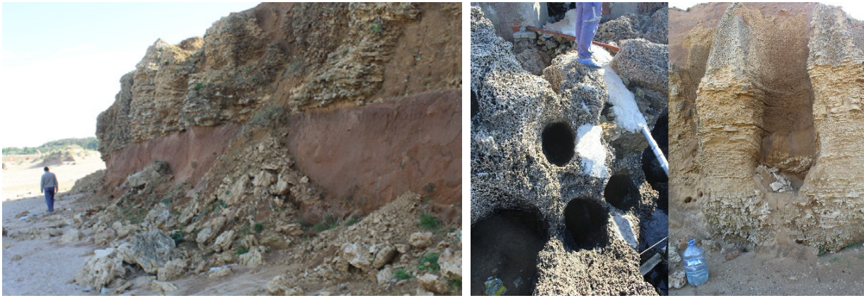
Fotoğraf – 3: Geçmiş dönemdeki ortam koşullarına göre oluşum gösteren paleosoller ve ortam koşullarının değişmesiyle meydana gelen kumul ilerlemesini durdurmak için çekilen setlerin oluşturduğu borular.

Son olarak sahada nispeten geniş bir plajın varlığı, bölgeyi turistik bir destinasyon haline getirmiştir. Bölgenin İstanbul şehrine yakın olması, özellikle sıcak aylarda bölge nüfusunun günübürlük artmasına neden olmuştur. Bu bakımdan bölgenin bir turistik uğrak yeri olmasından dolayı beşeri müdahaleler doğal ortamın şekillenmesinde rol oynamaya devam etmesini, dolaylı olarak da jeolojik ve jeomorfolojik oluşumların zarar görme riskini beraberinde getirmelidir.