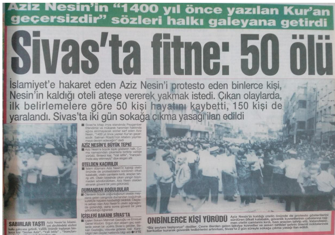
Şekil 6: Türkiye Gazetesi’nin Yaşananları Duyurduğu İlk Sayfa Düzeni (03.07.1993)

Haber metinlerinin içerisinde yer verilen tahrik vurgusunun kaynağını ise sadece “İslam düşmanı, ateist, şeytan, İslam’a hakaret eden” olarak nitelendirilen Aziz Nesin oluşturmaktadır. Olayı “ Nesin’in tahriklerinden dolayı galeyana gelen öfkeli kalabalığın haklı tepkisi ” olarak sunan gazete, yazılarında iki taraf oluşturmaktadır. Bir yanda tamamen suçlayıcı ve olumsuz ifadelerle tanımlanan, tahrikçi ve fitneci olarak damgalanan öteki Aziz Nesin, diğer yandan da dini inançlarına edilen hakarettten dolayı galeyana gelmiş biz öfkeli kalabalık bulunmaktadır. Olayın tek sorumlusu, suçlusu olarak gösterilmeye çalışılan Nesin’e karşılık, öfkeli halk “tahrik” edildiği gerekçesiyle eylemleri meşrulaştırılmaktadır. Bu sebeple de bize ait olumsuz eylemler bizden olmayan, bize yakışmayacak eylemlerde bulunan ötekine yüklenmektedir.