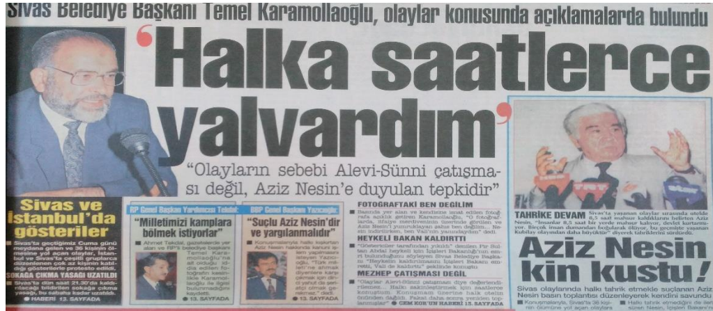
Şekil 7: Türkiye Gazetesi'nin Biz/Öteki Karşıtlığını Pekiştiren Sayfa Düzeni (05.07.1993)