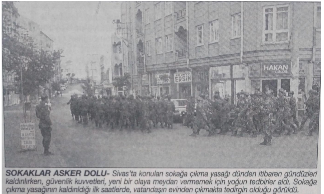
Şekil 11: “Sokaklar Asker Dolu” Notlu Fotoğraf (Türkiye Gazetesi, 06.07.1993)

SOKAKLAR ASKER DOLU- Sivas'ta konulan sokağa çıkma yasağı dünden itibaren gündüzleri kaldırılırken, güvenlik kuvvetleri, yeni bir olaya meydan vermemek için yoğun tedbirler aldı. Sokağa çıkma yasağının kaldırıldığı ilk saatlerde, vatandaşın evinden çıkmakta tedirgin olduğu görüldü.