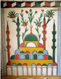
Görsel 10: Batı Duvarı Alt Seviyedeki Cami

Alt seviyede güneyden kuzeye ilk panoda cami tasviri görülmektedir (bkz. Görsel 10). Üç şerefeli dört minaresi ve kubbeli son cemaat yeri bulunan cami, yüksek merkezi bir kubbe ile örtülüdür. Kubbe ve minarelerin aralarını kırmızı gül ve laleler doldurmaktadır. Cami sarı renge, kubbeler ise kırmızı-mavi-yeşil renklere boyanmıştır. Minareler kırmızı ve yeşil renktedir. Dört minare, 12 şerefe ve merkezi kubbe, Edirne Selimiye Camii'nin tasvir edildiğini göstermektedir. İkinci, dördüncü ve yedinci panolarda mavi vazoyu dolduran sarı çiçekler, kırmızı güller ve lalelere yer verilmiştir. Üçüncü ve dördüncü panolar duvarı ikiye ayıran kuşakla diğer panolardan ayrılmıştır. Üçüncü panoda dokuz basamaklı cennet tasviri görülmektedir. Mavi-kırmızı çiçekli yeşil yapraklar, basamaklardan aşağı sarmaktadır. Dördüncü panoda kalkan boyaların altında kırmızı ve siyaha boyanmış basamaklardan cennet tasvirinin varlığı anlaşılabilir. Beşinci panoda mizan terazisi yer almaktadır. Üstte üç çatallı düzeneğin ucu mızrak şeklinde daralmakta ve iki yandaki kefeleri taşımaktadır. Mızrakla güneydeki kefe arasına bir makas yerleştirilmiştir. Boşluklar mavi çiçekler ile kırmızı gül ve lalelerle doldurulmuştur. Altıncı pano S kıvrımlı kırmızı-yeşil-mavi dal ve çiçeklerden oluşmuştur. Sekizinci panoya kırmızı ve yeşil yapraklı dalların oluşturduğu bir kompozisyon işlenmiştir.