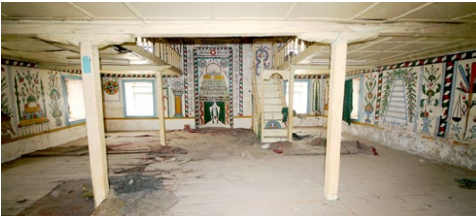
Görsel 5: Harim Mekânı Alt Seviyedeki Süslemelerin Görünüşü

Güney duvarında, ekseninde mihrab ve mihrabın batısında ahşap bir minber bulunmaktadır. Minberin kaş kemerli sembolik kapısı iki taraftan sütunçelerle sınırlandırılmıştır. Günümüzde yerinden düşmüş yarım daire şeklinde ahşaptan taç kısmı, yeşil, sarı, kırmızı, mavi ve beyaz renklere boyanmış yelpaze şeklinde düzenlenmiştir. Bunun çevresine iki şerit halinde ayet kitabesi işlenmiştir ( Kur'an-ı Kerim , Cuma Suresi, 9.). Minberin, yan aynalıklarında, tablaların oluşturduğu çarkifelek motifinin yanı sıra altı kollu çiçek, üçgen, dörtgen ve altıgenlerden oluşan basit süslemelere yer verilmiştir. Sütunlar üzerine oturan köşk sekizgen piramidal bir külâhla sonlanmaktadır.