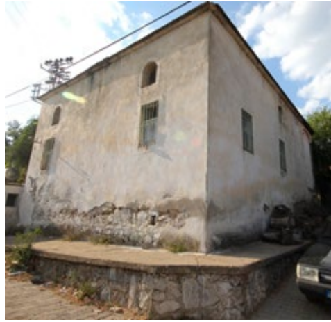
Görşel 2: Güneydoğudan Genel Görünüş

Yapının inşa tarihini veren herhangi bir kitabesi bulunmamaktadır. Caminin ek mekânının giriş kapısı üzerinde dayanağı bilinmeyen 1811 tarihli bir tabela görülmektedir. Caminin avlu duvarının kuzeydoğu köşesinde Osmanlıca yazılmış bir mezar taşı bulunmaktadır (bkz. Görşel 3).