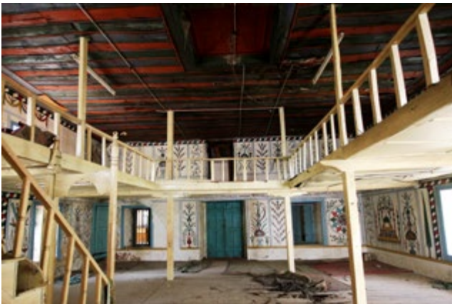
Görsel 12: Kuzey Duvarı

Alt seviyede batıdan doğuya ilk pano çerçeve içine alınmamış ve duvarı yatay olarak ikiye bölen kuşaktaki süsleme tekrar edilmiştir. İkinci panoda kompozisyon, duvarda oluşan geniş çatlağın alçıyla kapatılmış olması sebebiyle görülememektedir. Üçüncü panoda kırmızı ibrikten çıkan narçiçekleri, güller ve laleler bulunmaktadır. Kapının doğusundaki dördüncü panoda vazodan çıkan çiçek motifleri işlenmiştir. Beşinci panoda kırmızı-yeşil yapraklı mavi yapraklı dalların oluşturduğu bir süsleme görülmektedir. Pencerenin doğusundaki altıncı panoda daire içine alınmış kırmızı-mavi-yeşil renkli çarkifelek, yine aynı renklere sahip on iki kollu bir yıldızla çevrelenmiştir (bkz. Görsel 12).