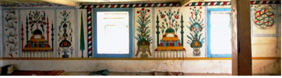
Görsel 14: Doğu Duvarı Alt Seviyedeki Süslemelerin Görünüşü

Üst seviyede kuzeyden güneye ilk panoda S kıvrımlı renkli dal ve aralarda çiçek kompozisyonu görülmektedir. İkinci ve beşinci panolarda vazodan çıkan çiçek motifine yer verilmiştir. Üçüncü panoda yeşil bir selvi ağacı motifi yer almaktadır. Dördüncü pano boş bırakılmıştır. Altıncı pano pencereyi de içine almakta ve pencerenin kuzeyinde S kıvrımlı kırmızı-mavi-yeşil renkli dal motifinden oluşmaktadır. Yedi, dokuz ve on birinci panoda Hz. Ebubekir, Hz. Ömer ve Hz. Osman isimleri işlenmiştir. Sekizinci panoda cami tasviri tekrar edilmiştir. Caminin güneyinde üç şerefeli uç, kuzeyinde iki şerefeli iki minaresi bulunmaktadır. Onuncu panoda kırmızı-yeşil yapraklı düz dal motifli kompozisyon yer almaktadır.