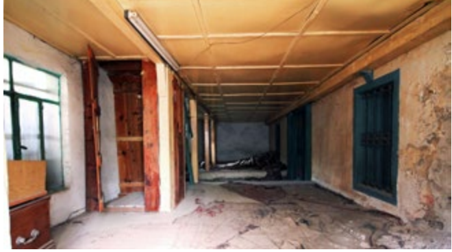
Görsel 3: Avlu Duvarındaki Mezar Taşı