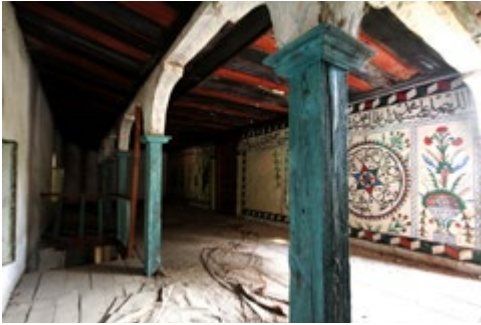
Görsel 6: Son Cemaat Yeri Üst Seviye

dairelerin kesişme noktalarının kırmızı, mavi ve yeşil renklere boyanmasıyla daire içine alınmıştır. Mühür ve altıgen içine alınmış altı kollu yıldız motifinin kolları da aynı renklere boyanmıştır. Üçüncü pano birinci pano ile benzenmektedir. Dördüncü panoda yeşil selvi ağacının iki yanından mavi-kırmızı-yeşil yapraklı dallar sarkmaktadır. Beşinci pano üst batı köşede bir demet gülden oluşan süsleme dışında boş bırakılmıştır. Kapının doğusundaki altıncı panoda ucu hilalle sonlanan direğe bağlanmış yeşil sancak, kırmızı saplı mavi teber ve sapı kırmızı iki uçlu mızrak yer almaktadır. Eksende yeşil taşlı tesbih bulunmaktadır. Tesbihin içine destarı mavi ve kırmızı Mevlevî sikkesi işlenmiştir. Mızrakla tesbih arasına mavi bir nefir yerleştirilmiştir. Tesbihin doğusuna birbirine paralel iki tüfek ve iki küçük barutlu silah yapılmıştır. Sapı mavi büyük tüfeğin ucu kırmızı üzerine siyah üçgenlerle bezenmiştir ve tetiğin yanından barut kesesi sarkmaktadır. Küçük tüfek mavi renklidir. Küçük barutlu silahların sapları mavi, uçları kırmızıdır. Kırmızı renkli kap bir keşkül olmalıdır. Sekizinci panoda daire içinde mavi, kırmızı, yeşil renkli çarkifelek motifi yer almaktadır. Daireyi aynı renklere boyanmış üçgenler ve dörtgenler ile kesişme noktaları boyalı yarım daireler çevrelemektedir. Dokuzuncu pano vazunun iki yanındaki lale motifleri dışında birinci panodaki süslemeleri yansıtmaktadır (bkz. Görsel 6-7).