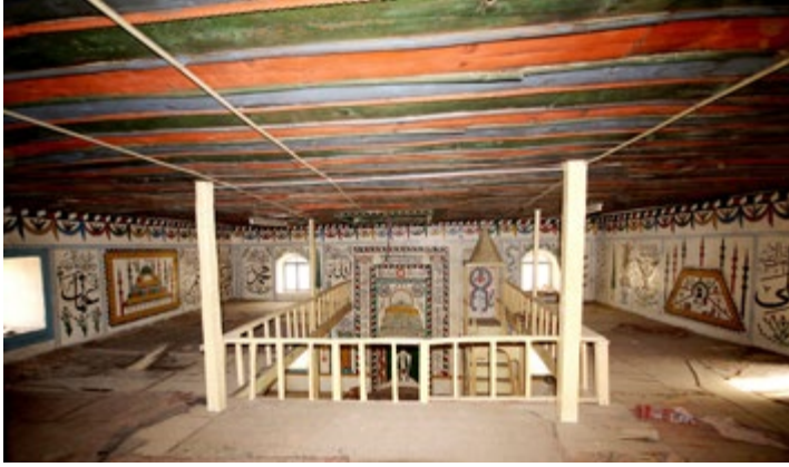
Görsel 9: Batı, Güney ve Doğu Duvarı Üst Seviyedeki Süslemelerin Görünüşü

Alt seviyede güneyden kuzeye ilk panoda cami tasviri görülmektedir (bkz. Görsel 10). Üç şerefeli dört minaresi ve kubbeli son cemaat yeri bulunan cami, yüksek merkezi bir kubbe ile örtülüdür. Kubbe ve minarelerin aralarını kırmızı gül ve laleler doldurmaktadır. Cami sarı renge, kubbeler ise kırmızı-mavi-yeşil renklere boyanmıştır. Minareler kırmızı ve yeşil renktedir. Dört minare, 12 şerefe ve merkezi kubbe, Edirne Selimiye Camii'nin tasvir edildiğini göstermektedir. İkinci, dördüncü ve yedinci panolarda mavi vazoyu dolduran sarı çiçekler, kırmızı güller ve lalelere yer verilmiştir. Üçüncü ve dördüncü panolar duvarı ikiye ayıran kuşakla diğer panolardan ayrılmıştır. Üçüncü panoda dokuz basamaklı cennet tasviri görülmektedir. Mavi-kırmızı çiçekli yeşil yapraklar, basamaklardan aşağı sarmaktadır. Dördüncü panoda kalkan boyaların altında kırmızı ve siyaha boyanmış basamaklardan cennet tasvirinin varlığı anlaşılabilir. Beşinci panoda mizan terazisi yer almaktadır. Üstte üç çatallı düzeneğin ucu mızrak şeklinde daralmakta ve iki yandaki kefeleri taşımaktadır. Mızrakla güneydeki kefe arasına bir makas yerleştirilmiştir. Boşluklar mavi çiçekler ile kırmızı gül ve lalelerle doldurulmuştur. Altıncı pano S kıvrımlı kırmızı-yeşil-mavi dal ve çiçeklerden oluşmuştur. Sekizinci panoya kırmızı ve yeşil yapraklı dalların oluşturduğu bir kompozisyon işlenmiştir.