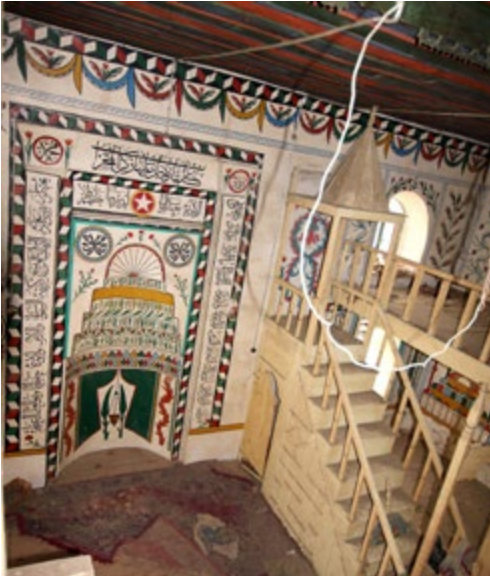
Görsel 15: Mihrap ve Minber

Üst seviyede, birinci panoda köşeleri gül demetleriyle doldurulmuş "Muhammed", üçüncü panoda "Allah" yazısı okunmaktadır. İkinci panoda pencerenin üst kısmı gül demetleriyle doldurulmuş, yanına da bir selvi ağacı yapılmıştır. Minberin köşk kısmındaki duvarda kırmızı-yeşil yaprakların oluşturduğu çelenk motifli dördüncü pano görülmektedir. Beşinci panoda S kıvrımlı dallar ve çiçeklerden oluşan süsleme bulunmaktadır. Altıncı panoda pencerenin üst kısmı gül demetleriyle doldurulmuştur. Yedinci panoda kırmızı-yeşil yapraklı düz bir dal motifi görülmektedir.