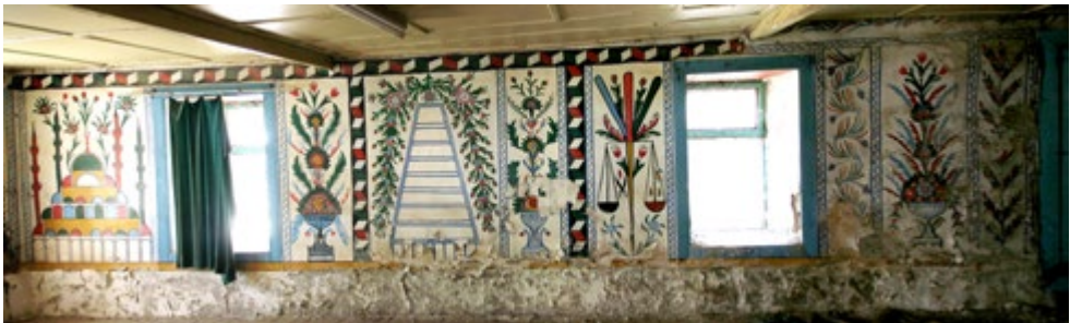
Görsel 8: Batı Duvarı Alt Seviyedeki Süslemelerin Görünüşü

3.2. Batı Duvarı: Duvarın alt seviyesindeki sekiz panodan biri güneydeki pencerenin güneyine, dördü iki pencerenin arasına, üçü kuzeydeki pencerenin kuzeyine yerleştirilmiştir (bkz. Görsel 8-9). Duvarın üst seviyesinde 10 adet pano yer almaktadır.