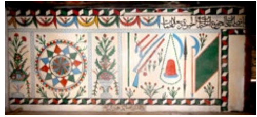
Görsel 7: Son Cemaat Yeri Üst Seviyedeki Süsleme Detayı

3.2. Batı Duvarı: Duvarın alt seviyesindeki sekiz panodan biri güneydeki pencerenin güneyine, dördü iki pencerenin arasına, üçü kuzeydeki pencerenin kuzeyine yerleştirilmiştir (bkz. Görsel 8-9). Duvarın üst seviyesinde 10 adet pano yer almaktadır.