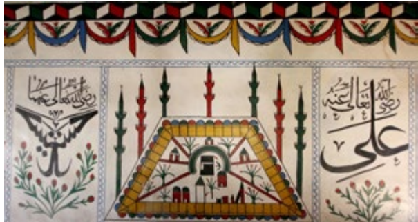
Görsel 11: Batı Duvarı Üst Seviyedeki Kâbe