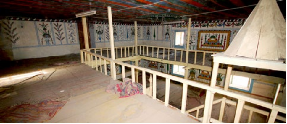
Görsel 13: Kuzey Duvarı Üst Seviyedeki Süslemelerin Görünüşü

Üst seviyede batıdan doğuya ilk pano kırmızı-yeşil yapraklı S kıvrımlı mavi dal kompozisyonundan oluşmaktadır. İkinci panonun batı yarısı kırmızı-yeşil yapraklı düz bir dal motifiyle doldurulmuş, doğu yarısı da boş bırakılmıştır. Üç, sekiz ve on birinci pano vazodan çıkan çiçek motifiyle bezenmiştir. Dört, yedi ve on ikinci pano, ikinci panodaki süslemeleri tekrar etmektedir. Beşinci ve dokuzuncu panoda S kıvrımlı kırmızı-mavi-yeşil renkli dal ve çiçek motifi tekrar edilmektedir. Kapının doğusundaki altıncı panoda mavi bir ibriği kırmızı narçiçekleri, güller, laleler ve yeşil yapraklar doldurmaktadır. Onuncu panoda S kıvrımlı kırmızı-yeşil-mavi dallarla çevrili mavi bir selvi ağacı görülmektedir (bkz. Görsel 13).