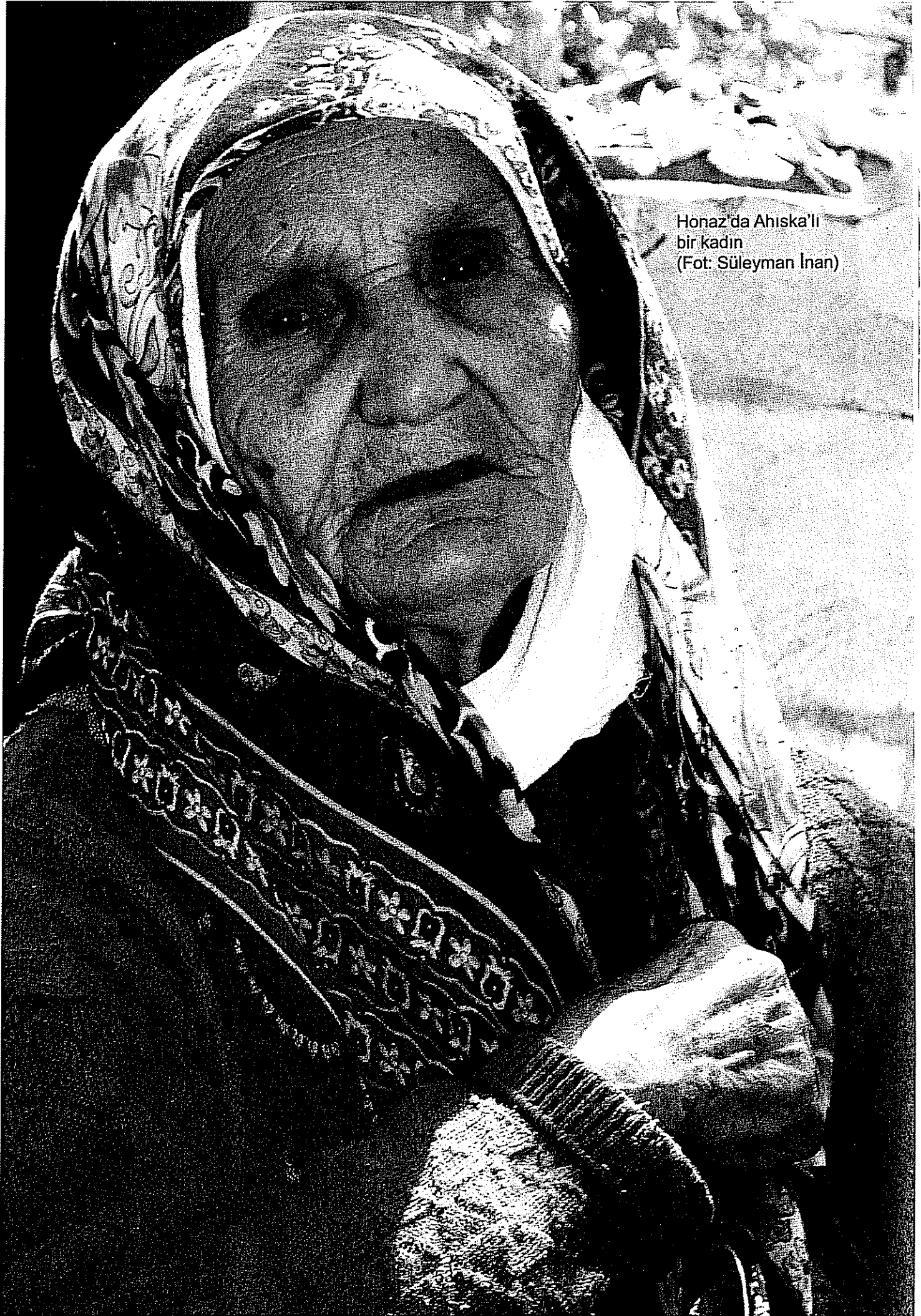
Honaz'da Ahiska'lı bir kadın