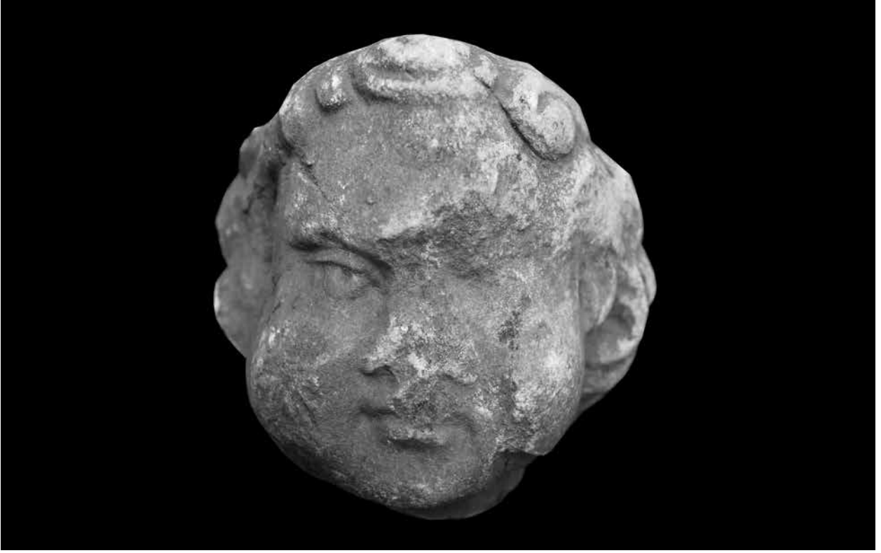
Figür 1: Çocuk tanrı Eros'a ait baş, cepheden.