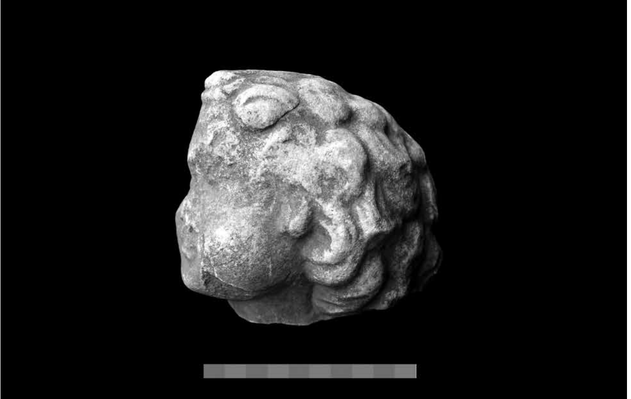
Figür 2: Eros başı, sol profilden.