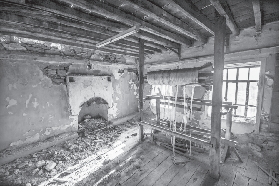
Fotoğraf 8: Terk edilen bir konut yapısında korunan ahşap dokuma tezgâhı