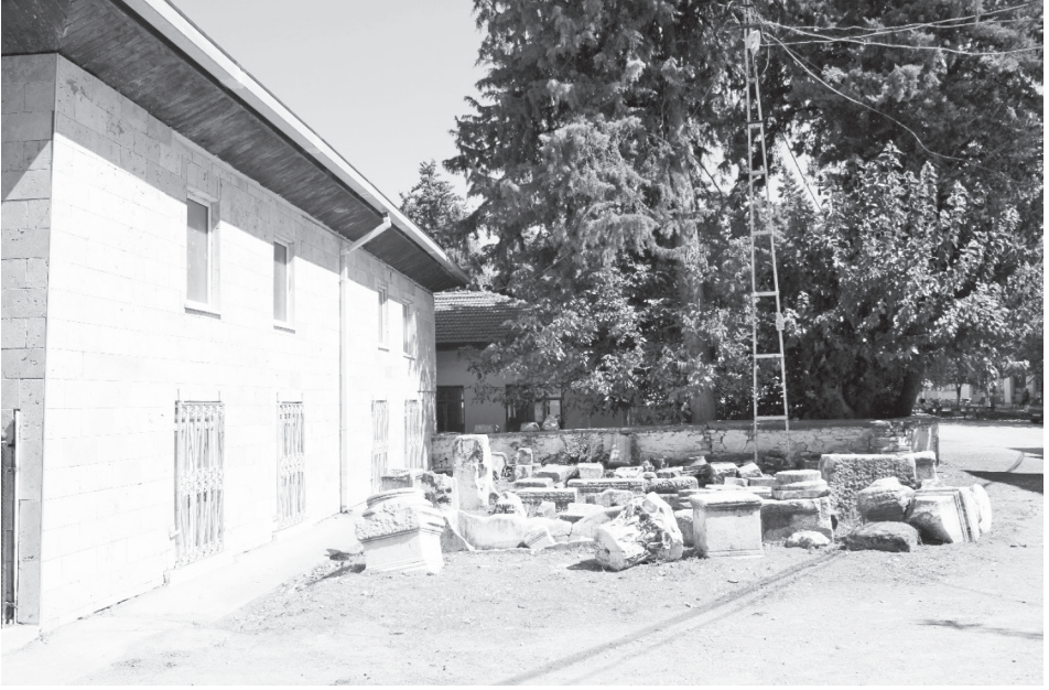
Fotoğraf 3: Hisarköy Camii'nin bahçesine toplanan mimari bloklar (Hellenistik, Roma İmparatorluk, Bizans ve Osmanlı Dönemi)