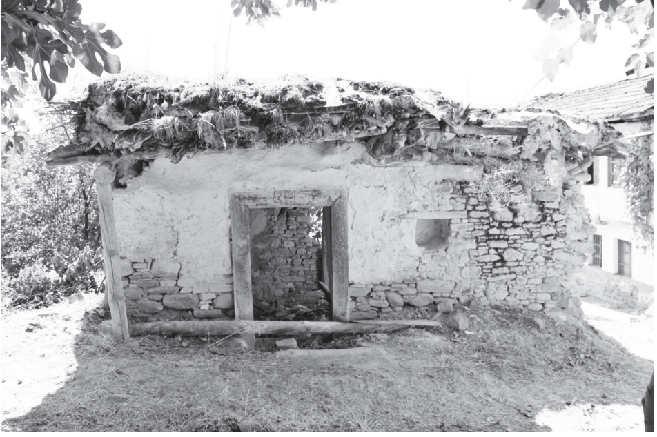
Fotoğraf 7: Tek katlı ve düz damlı olarak inşa edilmiş geleneksel bir konut (tescilli) yapısı