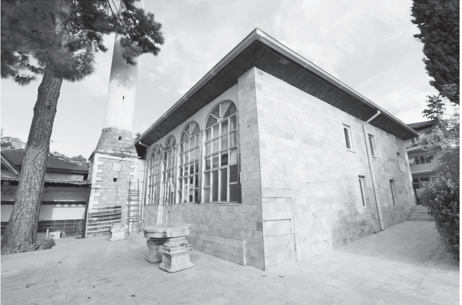
Fotoğraf 4: 1880 yılında inşa edilen Hisar Köyü Camii ve avlusunda musalla taşı olarak kullanılan Roma İmparatorluk Dönemi'ne ait mimari bloklar