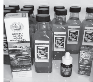
Fotoğraf 11: Yerleşimin çevresinde yetişen kekikle damıtma yöntemiyle üretilen kekik suyu