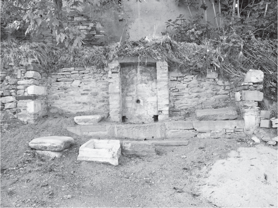
Fotoğraf 6: 1952 yılında yapılan köy çeşmesinde kullanılan antik bloklar