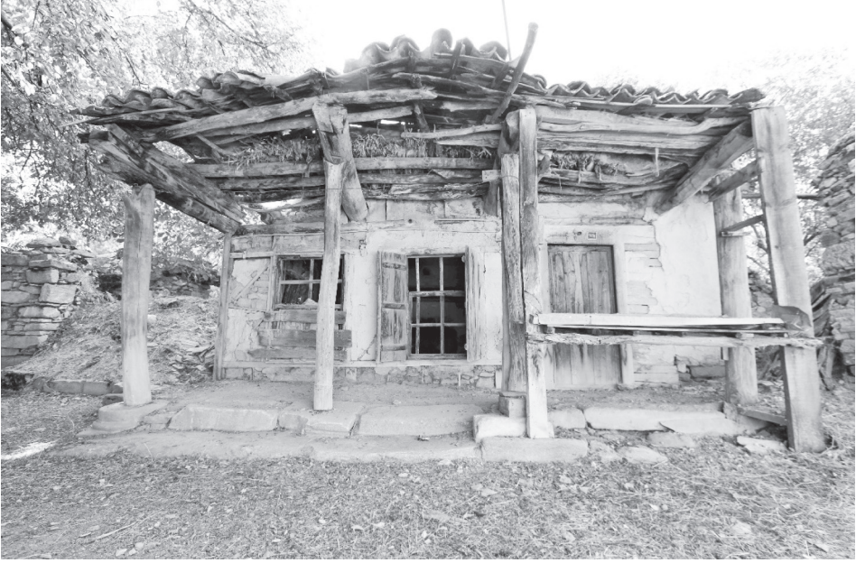
Fotoğraf 5: Mecnun Dede Türbesi'nin güneybatısındaki konut ve zeminde kullanılan sütun kaideleri ile çeşitli mimari bloklar