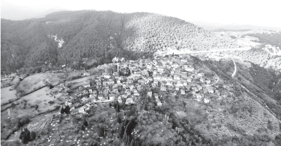
Fotoğraf 2: Attouda'nın (Hisar Köyü/Hisar Mahallesi) havadan görünümü