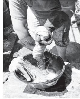
Fotoğraf 10: Hisar'ın geçim kaynaklarından birisi olan dokumacılıkla ilişkili ahşap çıkırık, motorlu tezgâh ve iplik boyama