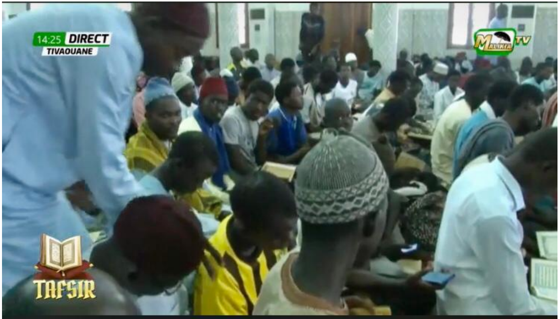
Öğrenciler ders dinlerken