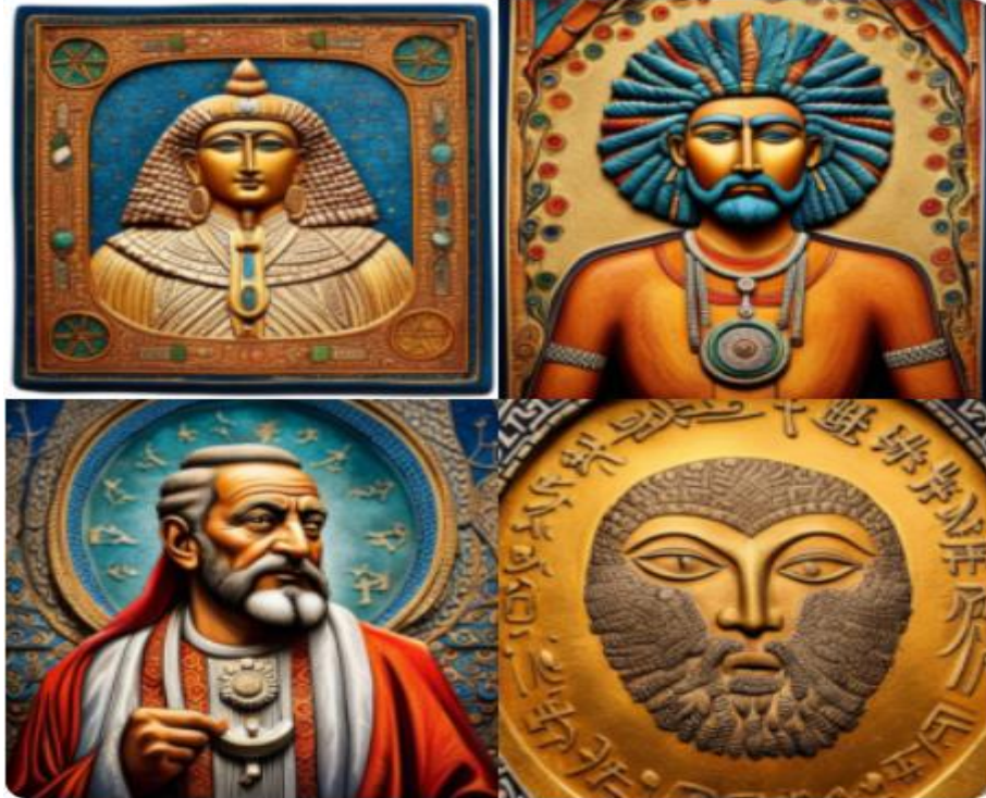
Şekil 1. Anadolu- Mezopotamya Sembolik Benzeşimleri ve Değerlendirilmesi

Tanrı ve Tanrıça Sembolleri: Hem Anadolu hem de Mezopotamya uygarlıklarında, tanrı ve tanrıçalar önemli bir yere sahiptir. Bu tanrılar, bereket, savaş, doğa ve daha birçok alanı temsil eder. İnanna (veya İştâr) gibi tanrıçalar hem Mezopotamya hem de Anadolu'da benzer şekillerde tasvir edilmiştir.