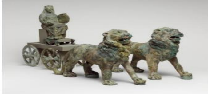
Şekil 2. Ana Tanrıça Kybele