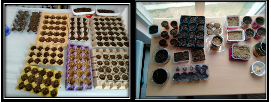
Şekil 1 Tohum ekimi.

Sorumluluk deęerinin katılımcılarda gözlemlenebilmesi için katılımcı grup ile fide ve saksı bitkisi yetiştirip bu ürünlerin sorumluluklarını taşıyacakları görevler vermeye karar verilmiştir. Aynı zamanda bu bitkilerin gelişimine paralel dallarına hadisler asılması, hadis bitkisi adı verilen bu uygulama kapsamında saksı, viyo, tohum, çeşitli bitki yetiştirmede kullanılacak ekipmanlar tedarik edilmiştir. 07/11/2023 tarihi itibari ile fen bilimleri laboratuvarında araştırmanın katılımcısı olan 15 öğrenciden 12'sinin katılımı ile tohum ekimi ve fide dikimi yapılmıştır. Etkinliğe ilişkin görsellere aşağıda yer alan Şekil 1'de yer verilmiştir.