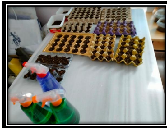
Şekil 2 Fide bakımı

Yukarıda yer alan şekil-1'de katılımcı grubun çeşitli bitki tohumlarını araştırmacının yönlendirmesi ile viyollere ve saksılara ekimi görülmektedir. Tohum ve fide ekim dikim aşamasından sonra katılımcılar gruplandırılarak fide ve tohumların bakımı ile görevlendirilmiştir. Haftalık olarak gelişimleri izlemek, bitkilerin sulama ve diğer ihtiyaçlarını karşılamak sorumluluğu katılımcılara verilmiştir. Aşağıda yer alan şekil-2'de bu çalışmalar yer almaktadır.