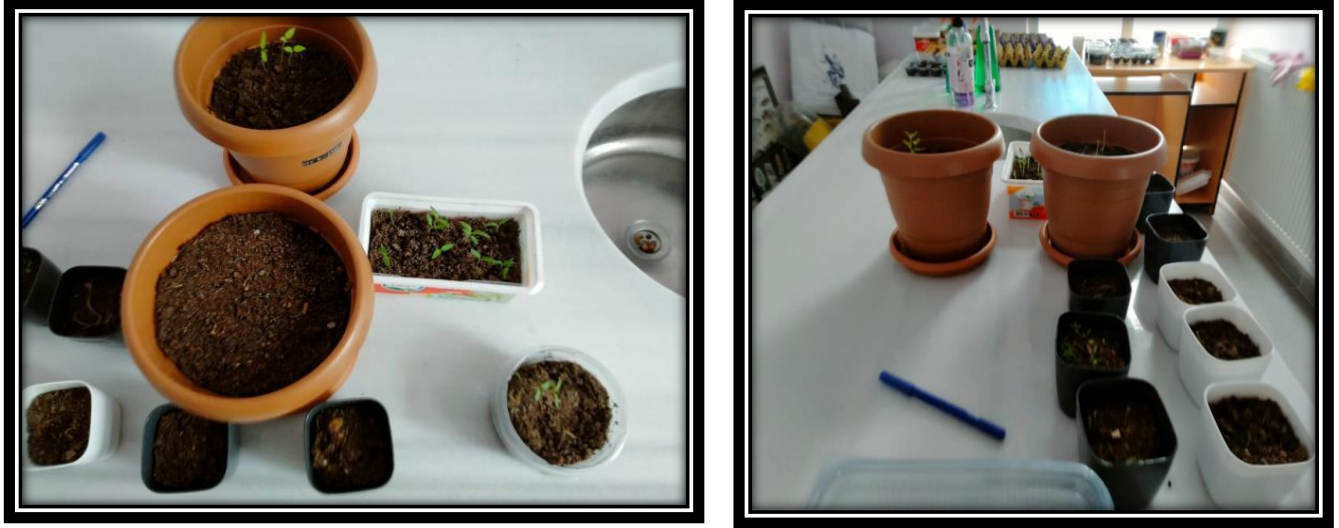
Şekil 4 İkinci hafta ürün gelişimleri.

Katılımcı grubun sorumluluğunda ikinci haftaya ilişkin ürün gelişimleri aşağıda yer alan Şekil-4'te gösterilmiştir.