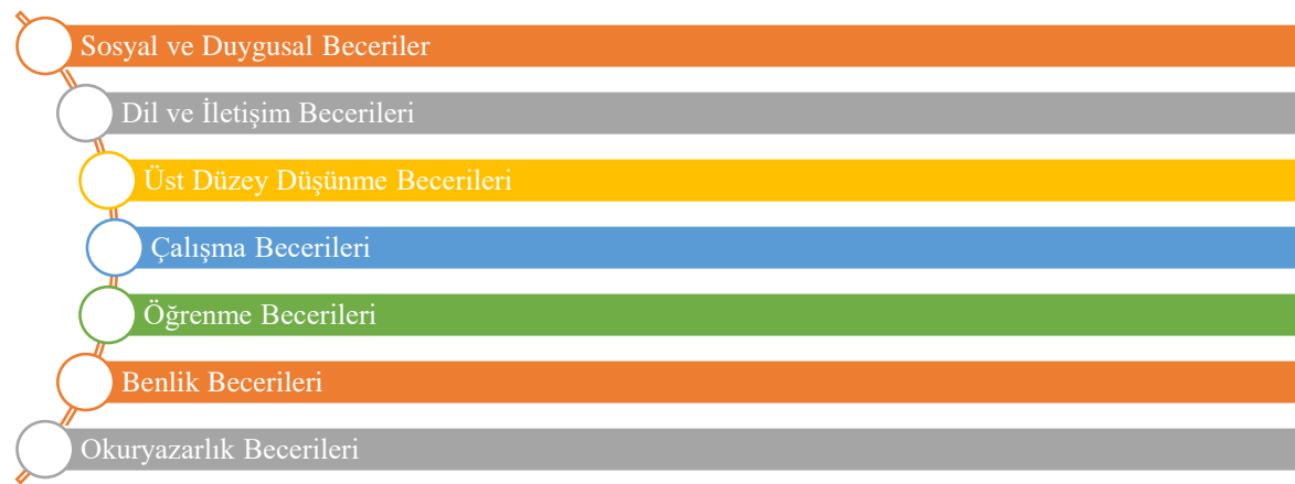
Şekil 2.1. Milli Eğitim Bakanlığı 21. yy becerileri

Milli Eğitim Bakanlığı (MEB) yaptığı ulusal ve uluslararası araştırmalar neticesinde sahip olunması gereken 21.yüzyıl becerilerini 7 ana beceri sınıfına koymuştur. Bu beceri sınıfları şunlardır (MEB, 2023):