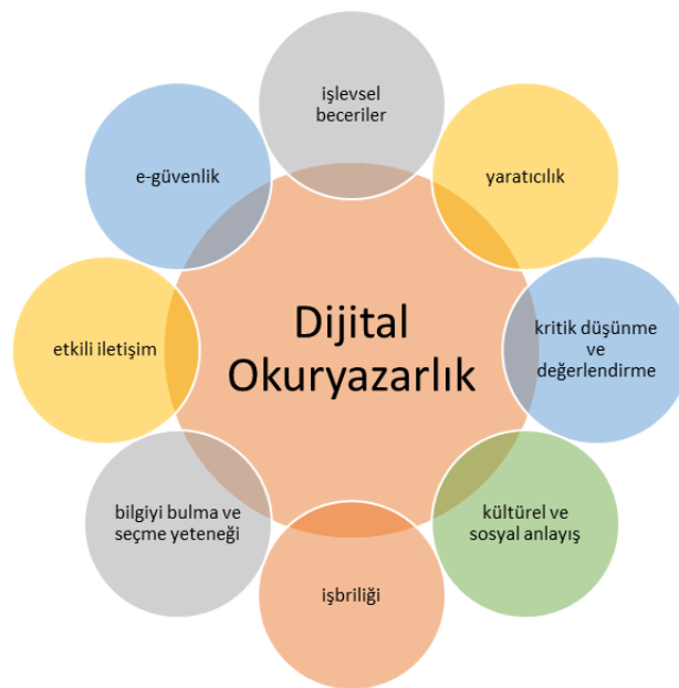
Şekil 2.3. Dijital okuryazarlığın bileşenleri

Şekil 2.3'te gösterildiği gibi dijital okuryazarlık bileşenlerini sekiz farklı bileşen olarak ele almışlardır (Payton ve Hague, 2010, s.19),