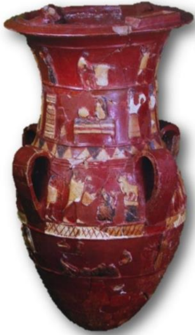
İnandık Vazo'su. İ. T. Sipahi 2014, Res.8, s. 42.